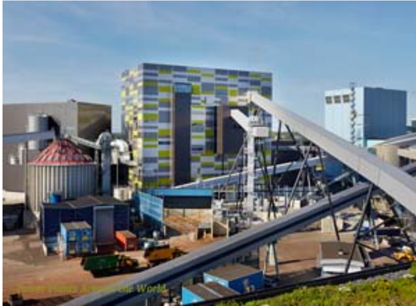
Slika 14 Postrojenje za dobivanje energije iz otpada snage 50 MW, Mälarenergi Unit-6 [26]