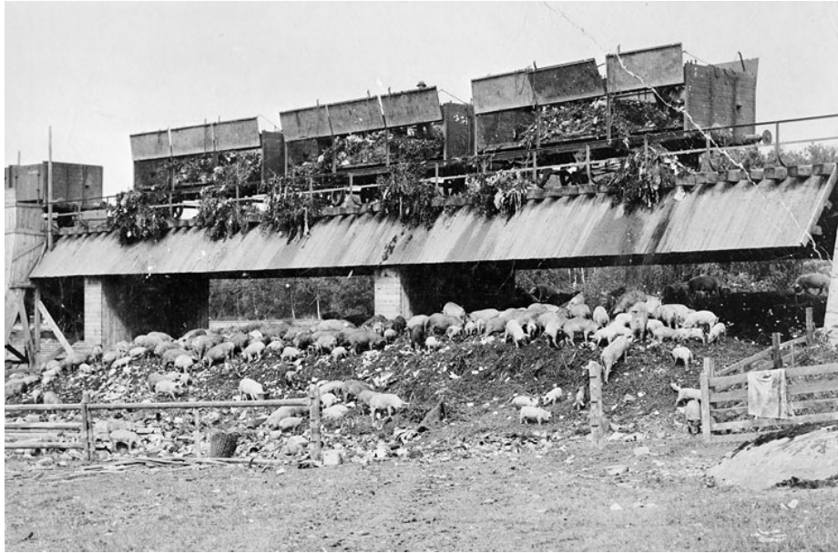
Slika 13 Farma svinja hranjene biootpadom [24]

upotreba kemikalija, tako je povećana i količina opasnog otpada koji se odlagao na odlagalištima. Sve do ranih 1970-ih je to bila općenito prihvaćena metoda upravljanja takvim otpadom. Nakon toga sa radom počinju spalionice otpada. Tvrtka koja se time bavila zvala se GRAAB i bila je u vlasništvu grada Göteborga i nekoliko okolnih gradova. U početku je postrojenje onečišćavalo zrak, no to je vremenom smanjeno na minimum zahvaljujući investicijama u tehnologiju pročišćavanja.