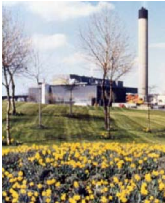
Slika 25 Spalionica u Edmontonu 1980-ih [40]

kompostiranje su također napredovali. Međutim, odlagališta su i dalje bila dominantan način za gospodarenje otpada. [40]