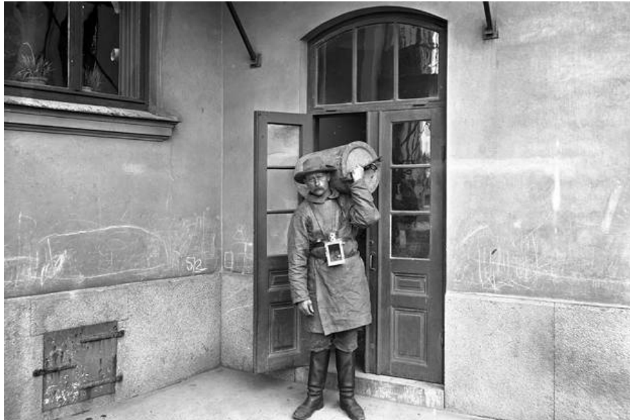
Slika 12 Radnik iznosi otpad iz zahoda [23]

Odjel za čišćenje u vlasništvu grada započeo je raditi 1885. godine u Göteborgu zbog loše higijenske situacije u gradu u kojem su se širile bolesti poput kolere. Odjel za čišćenje postao je odgovoran za sakupljanje kućnog otpada i otpada iz zahoda, prikazano na Slici 12. Na mjestu na kojem se sakupljao otpad izgrađena je tvornica gnojiva. Godine 1907. u Göteborgu u upotrebu su ušli zahodi s vodom za ispiranje pa se postupno čitav otpad iz zahoda zbrinjavao na taj način. [20]