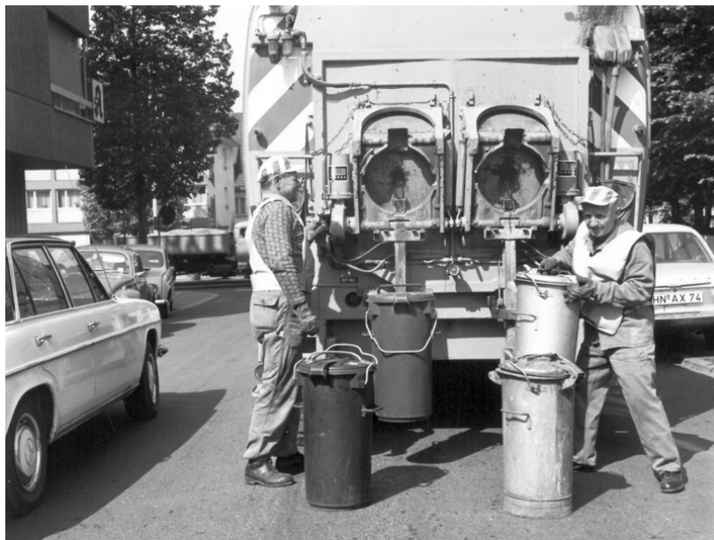
Slika 16 Odvoz otpada 1972. godine u Beču [28]

U Beču su 1964. godine uvedeni čelični kontejneri od 1100 litara, prvi takvi u Europi, a 1974. godine su zamijenjeni plastičnim i čeličnim kantama kapaciteta od 120 i 240 litara, utovar plastičnih i čeličnih kanti prikazan je na Slici 16. Stanovnici Beča plaćaju odvoz smeća od 1934. godine, a od 1965. godine se ono odvozi jednom tjedno. [20]