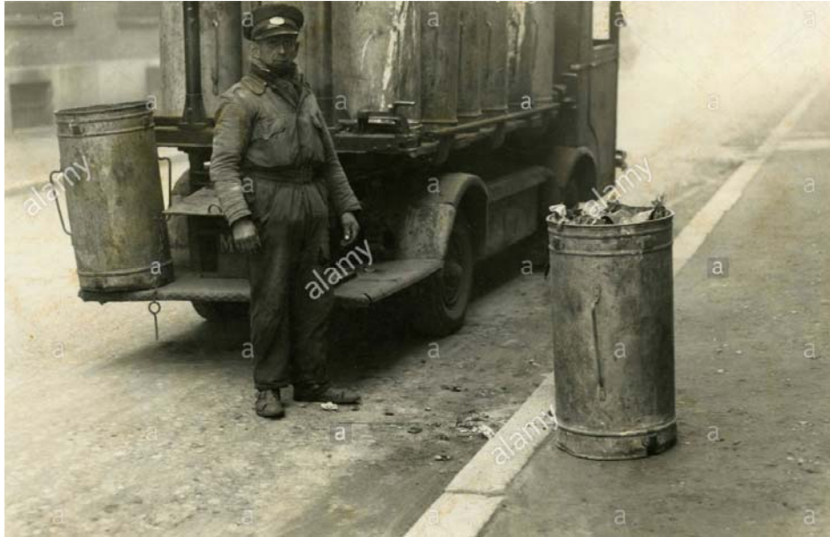
Slika 17 Odvoz otpada, Italija 1960-ih godina [32]

Otpad se većinom odlagao na odlagališta. U ruralnim područjima biootpad su koristili za gnojidbu tla, a preostali otpad su bacili na neprimjeren način ili ga spalili. Krajem šezdesetih godina, količine otpada su se povećale što je uzrokovalo nekontrolirano odlaganje sa negativnim učincima na kvalitetu okoliša. Za odlagališta otpada su koristili razne udubine, a tako i zatvorene kamenolome. [31]