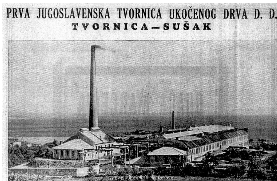
Slika 2 Tvornica ukočenog drva Sušak [11]

Godine 1931. podignuta je tvornica ukočenog drva (UKOD) koja je proizvodila šperploče i panel-ploče. Tvornica se nalazila na Sušaku. Piljevina i drveni otpaci nastali u proizvodnji spaljivali su se u kotlu, koji je bio vlasništvo tvornice, ogrjevne površine 230 m 2 za proizvodnju pare tlaka 24 bara te trofazni generator snage 208 kVA. Tvornica ukočenog drva prikazana je na Slici 2. [10]