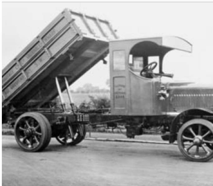
Slika 23 Vozila za odvoz otpada 1920-ih godina [40]

Ukoliko bi usporedili količinu otpada tada i sto godina prije, uvidjeli bi da se količina otpada nije promijenila, ali je zato sastav otpada bio vidno promijenjen. Osim što se promijenio sastav otpada promijenio se i odvoz otpada te su 1920-ih godina motorna vozila zamijenila kola na konjsku vuču, prikaz motornog vozila nalazi se na Slici 23. [40]