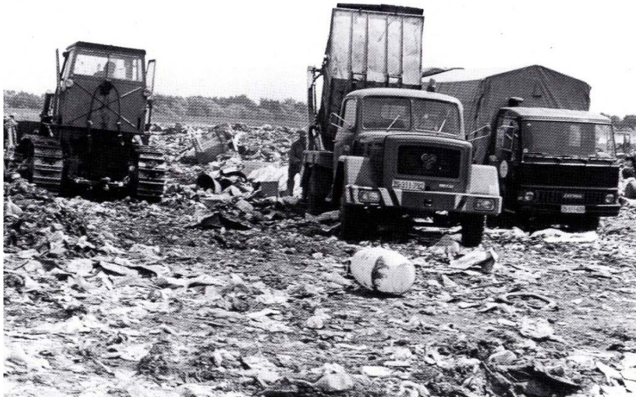
Slika 4 Odlagalište otpada 1960-ih [12]