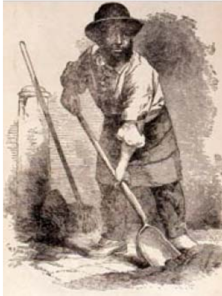
Slika 21 Čistač ulice krajem 18. stoljeća [40]

Krajem 18. stoljeća i početkom 19. stoljeća u Londonu je postojao neslužbeni način recikliranja otpada i sustav gospodarenja otpadom. Industrijska revolucija i migracija stanovništva u gradove značila je da se otpad sastojao uglavnom od ugljene prašine iz kućnih peći za kojim je potražnja bila velika. Prašina se koristila za proizvodnju opeke koju je London jako trebao. [40]