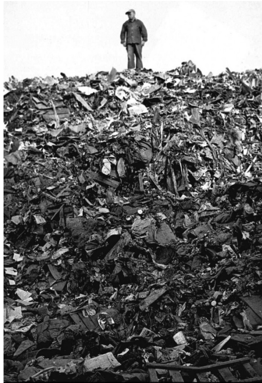
Slika 28 Odlagalište otpada u SAD-u 1950-ih [45]

godine savezna vlast konačno u Kongresu donosi Zakon o komunalnom otpadu. Njime se određivao financijski i tehnički aspekt gospodarenja otpadom, dakle sakupljanje, transport i odlaganje. Kongres je 1970. godine donio Zakon o obnovljivim izvorima i time uveo otpad u proces recikliranja i proizvodnje energije. [43]