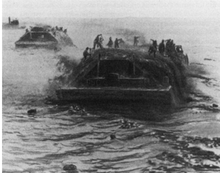
Slika 26 Odlaganje otpada u more [43]