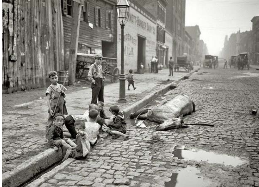
Slika 27 Uginuli konj leži na ulici [44]

Amerika se snažno počela razvijati kao industrijska zemlja, pa je pitanje odlaganja industrijskog otpada postalo jako važno. Uvidjela se veza između otpada i bolesti koje su 1870. godine izazvale epidemije. Kolera je u Missisipiju odnijela 3000 ljudskih života, a New Orleans i Memphis je pogodila epidemija žute groznice. Zahvaljujući tome savezna vlada je shvatila da se mora pozabaviti sanitarnim pitanjem te je 1879. godine osnovan Odbor za nacionalno zdravlje. [43]