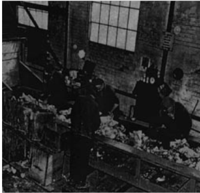
Slika 24 Radnici na pokretnoj traci odvajaju otpad [40]

tim novim postrojenjima zamijenili su stare peći za spaljivanje otpada novim, modernijim spalionicama koja su smanjila onečišćenja. Odvajanje metala se izvodilo pomoću velikih magneta što je imalo važno ulogu u Drugom svjetskom ratu jer se omogućilo recikliranje sirovina potrebnih za proizvodnju ratne opreme kao što su željezo i aluminij. Odvajanje kartona, papira, krpa i nemetala izvodilo se ručno na sporim pokretnim trakama što je smanjilo volumen otpada koji se spaljivao, način rada prikazan je na Slici 24. [40]