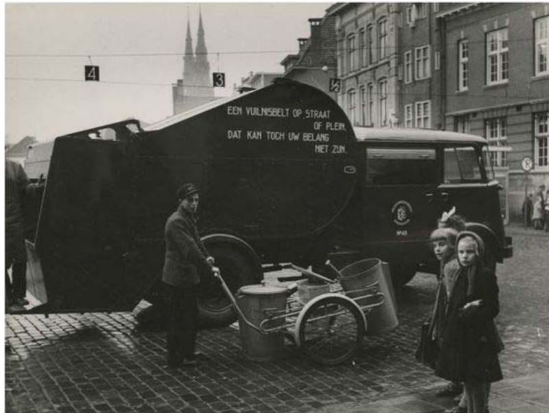
Slika 20 Sakupljanje otpada u Nizozemskoj 1960-ih [38]

1960-ih godina osnivaju se nacionalne organizacije za zaštitu okoliša koje svojim radom povećavaju osviještenost građana o štetnom djelovanju otpada i kritiziraju rad postrojenja. Rezultatom toga 1970-ih stvaraju kampanju protiv nepovratne ambalaže, čime se označava propast starog režima otpada. [36]