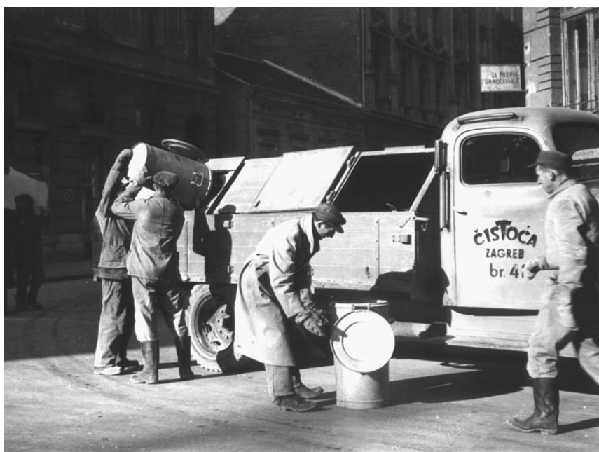
Slika 3 Kamion „Čistoće“ za odvoz otpada [12]

Zaprežna konjska vuča zadržana je do 1950./51. godine u gradu Zagrebu. Od te godine uveden je kamionski prijevoz otpadaka s tim da su prvi kamioni bili s drvenim sanducima sa poklopcima koji su prikazani na Slici 3. Uvođenjem organiziranog odvoza otpada iz naselja javio se problem mjesta i prostora na kojem se otpad treba odložiti. [7]