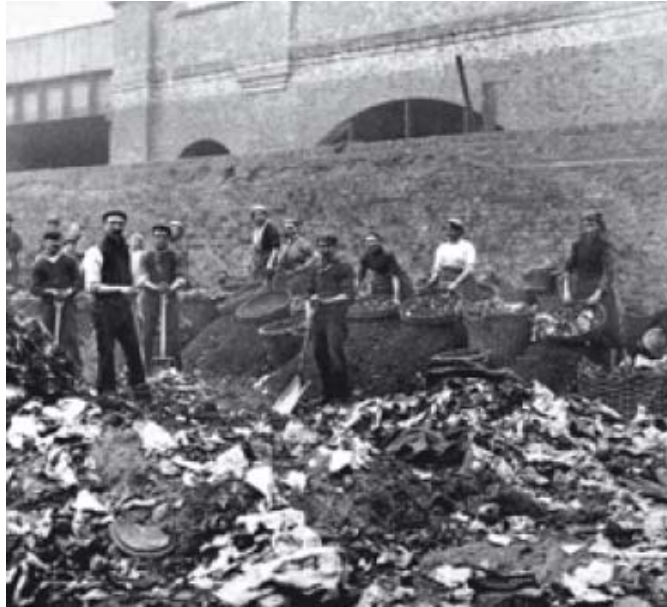
Slika 22 Udruga čistača Londona 1900-ih godina [40]

Ukoliko bi usporedili količinu otpada tada i sto godina prije, uvidjeli bi da se količina otpada nije promijenila, ali je zato sastav otpada bio vidno promijenjen. Osim što se promijenio sastav otpada promijenio se i odvoz otpada te su 1920-ih godina motorna vozila zamijenila kola na konjsku vuču, prikaz motornog vozila nalazi se na Slici 23. [40]