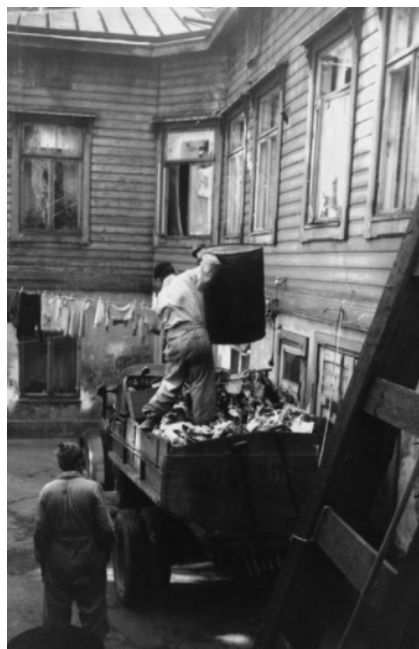
Slika 10 Utovar otpada u Finskoj 1920-ih [22]

Već 1904. godine u Helsinkiju je počelo sakupljanje otpada u kante, a 1910. godine pojavila se i prava shema odvajanja otpada korištenjem više kanti. Tada se odvojeno sakupljao biorazgradivi otpad, gnojivo, ostaci hrane i pepeo u 110 - litarskim kantama, a utovar takvog otpada prikazano je na Slici 10. Navedena shema odvajanja otpada se izjalovila do 1928. jer je jednostavno bila preskupa. Nakon toga počelo je sakupljanja miješanog otpada sa označenih skupljališta diljem grada.