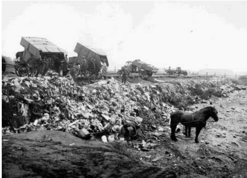
Slika 19 Istovar otpada na odlagalište, Nizozemska krajem 19. stoljeća [37]

Prvi zakon o otpadu u Nizozemskoj datira iz 19. stoljeća kojim se željelo zaštititi zdravlje ljudi. Prikupljanje otpada u drugoj polovici 19. stoljeća su izvodile privatne tvrtke, a 1890-ih taj zadatak organiziraju općine koje imaju svoje udruge za sakupljanje otpada. Prikupljeni otpad su odlagali na odlagalištima otpada, što se nalazi na Slici 19. [36]