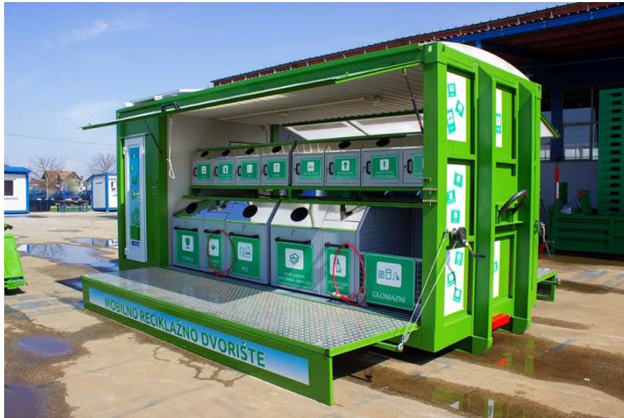
Slika 6 Mobilno reciklažno dvorište [14]

nije zadovoljavajući te ga je u narednom razdoblju potrebno povećati. U tu svrhu potrebno je nastaviti s izgradnjom reciklažnih dvorišta, odnosno nabavom mobilnih reciklažnih dvorišta. Prikaz modernih mobilnih reciklažnih dvorišta prikazano je na Slici 6. [13]