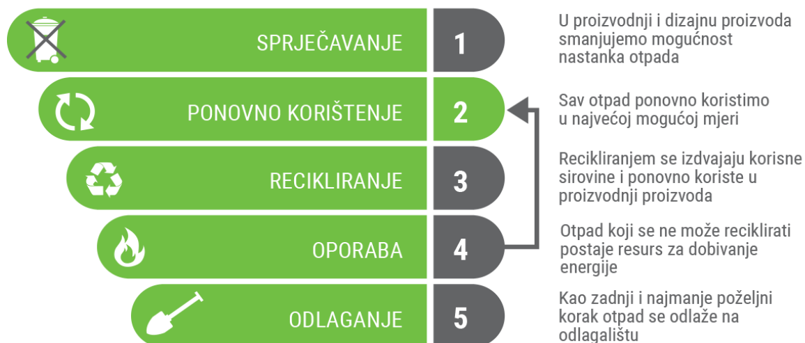
Slika 8 Hijerarhija otpada [16]

Načelom „Onečišćivač plaća“ EU-a je osigurala stabilan izvor financiranja za troškove zbrinjavanja otpada. Također, tim se načelom poticalo proizvođače da dizajniraju proizvode na jednostavniji način kako bi se smanjio trošak recikliranja. [15]