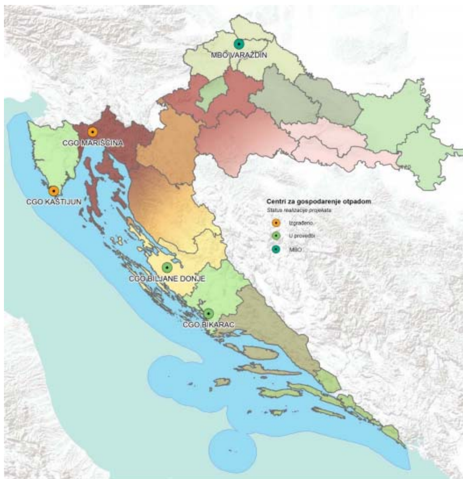
Slika 7 Položaj izgrađenih CGO-a, CGO-a u provedbi i postrojenje za MBO [13]