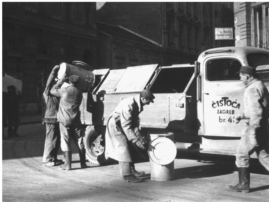
Slika 3 Kamion „Čistoće“ za odvoz otpada [12]

Zaprežna konjska vuča zadržana je do 1950./51. godine u gradu Zagrebu. Od te godine uveden je kamionski prijevoz otpadaka s tim da su prvi kamioni bili s drvenim sanducima sa poklopcima koji su prikazani na Slici 3. Uvođenjem organiziranog odvoza otpada iz naselja javio se problem mjesta i prostora na kojem se otpad treba odložiti. [7]