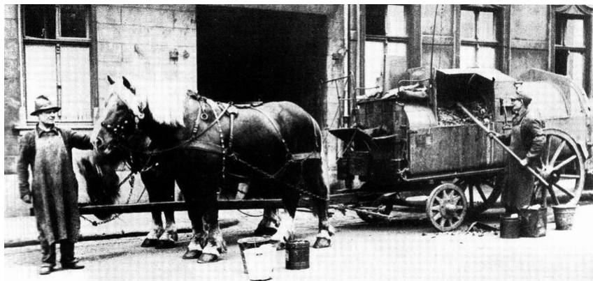
Slika 15 Radnici tvrtke „ Sakupljači Otpada “ [27]

U Beču prije 1900. godine odlaganje otpada nije bilo visoko na dnevnom redu. Otpad se odlagao u kućama, iznosio se na cestu, odakle ga je sakupljala i odvozila tvrtka „ Sakupljači Otpada “ sa svojim konjima i kolima. Godine 1904. bečke vlasti su imale 104 vozila s konjskom zapregom koja su dolazak oglašavala zvoncima te bi građani svoje kante sa otpadom donosili do vozila, gdje bi ih radnici praznili, prikaz takvih vozila nalazi se na Slici 15. Jedan od velikih zdravstvenih problema bila je prašina. Problem su pokušali riješiti vrećama i drugim sistemima, ali ni jedan nije davao rezultate. Otpad se tada sastojao do pepela i drugih prašnjavih ili vrlo teških materijala. Stoga je odlučeno da se koriste čelični kontejneri jer su čvršći i otporni su na vatru. [20]