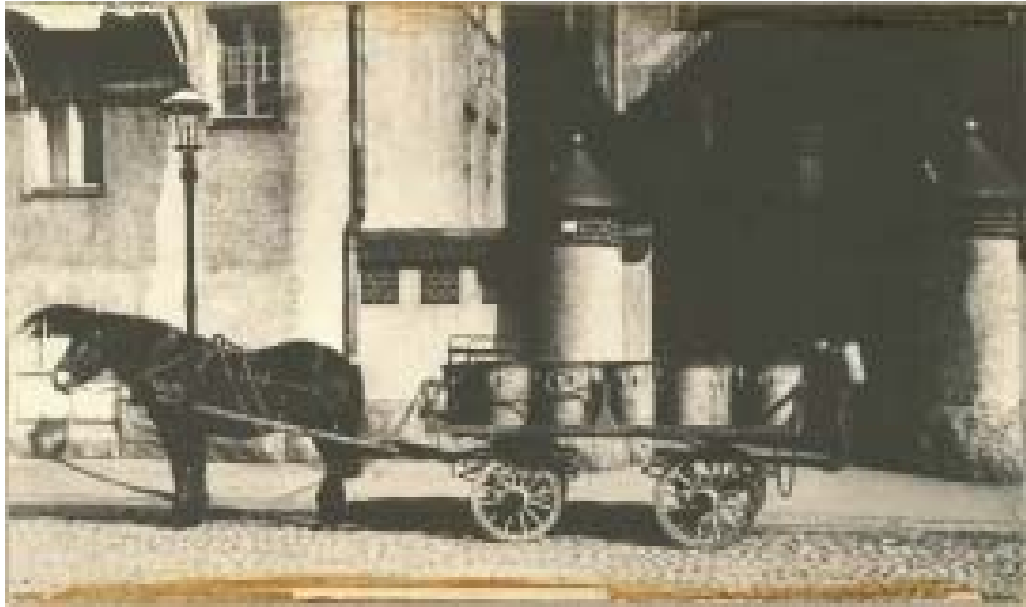
Slika 9 Prijevoz otpad iz zahoda u Finskoj početkom 20. stoljeća [21]

Već 1904. godine u Helsinkiju je počelo sakupljanje otpada u kante, a 1910. godine pojavila se i prava shema odvajanja otpada korištenjem više kanti. Tada se odvojeno sakupljao biorazgradivi otpad, gnojivo, ostaci hrane i pepeo u 110 - litarskim kantama, a utovar takvog otpada prikazano je na Slici 10. Navedena shema odvajanja otpada se izjalovila do 1928. jer je jednostavno bila preskupa. Nakon toga počelo je sakupljanja miješanog otpada sa označenih skupljališta diljem grada.