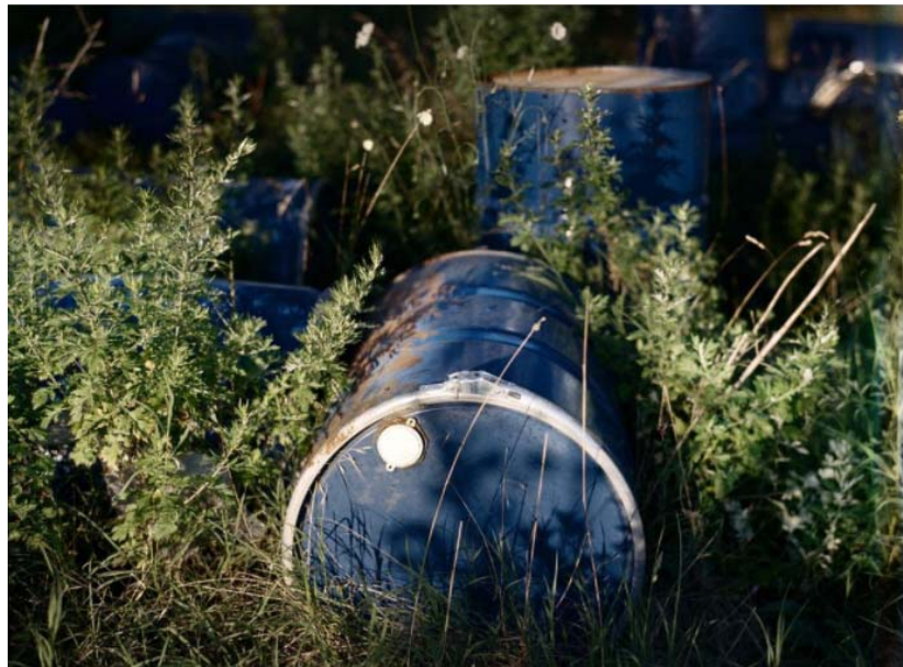
Slika 18 Odložene bačve opasnog otpada u „trokutu smrti“ [34]

Poznato je da se u Italiji mafija pod nazivom „Camorra“ uključila u ilegalno gospodarenje otpada 1990-ih godina. Mafija „Camorra“ je brodovima dovozila opasni toksični otpad u luku Napulja, odakle je kamionima prevozila opasni toksični otpad u blizini Napulja i tamo ga ilegalno odlagali. To se odlagalište toksičnog otpada nazvalo „trokut smrti“. Prikaz odlagališta nalazi se na Slici 18. Pretpostavlja se da je od 1990-ih godina do danas u spomenutom trokutu odloženo oko deset milijuna tona otpada. Ilegalnim odlaganjem toksičnog otpada došlo je do onečišćenja vode, tla i zraka u okolici odlagališta. Oko deset tisuća ljudi je od 2005. umrlo zbog raka ili plućnih oboljenja kao posljedice ilegalnog odlaganja toksičnog otpada u tom području. Istraživanja su pokazala da su se u hrani (povrću, voću, siru, mlijeku, itd.) nalaze povećane količine toksičnih tvari. [33]