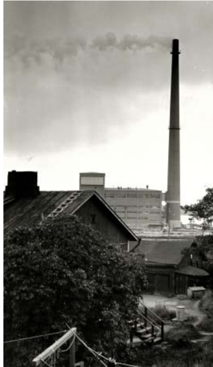
Slika 11 Spalionica u Finskoj 1960-ih godina [21]

Novo gradske zgrade su bile opremljene pećima za spaljivanje koje su proizvodile smrad i gust dim, one su se koristile sve do 1960-ih godina prošlog stoljeća kad su potpuno zabranjene. Na Slici 11 nalazi se prikaz spalionica iz 1960-ih. Prvi nacionalni zakon o otpadu je donesen kasnih 70-ih godina, a zahtijevao je velik napor da se primijeni u praksi upravljanja otpadom u svim gradovima. Novi zakon o otpadu, usklađen s direktivama EU, stupio je na snagu 1994. godine. [20]