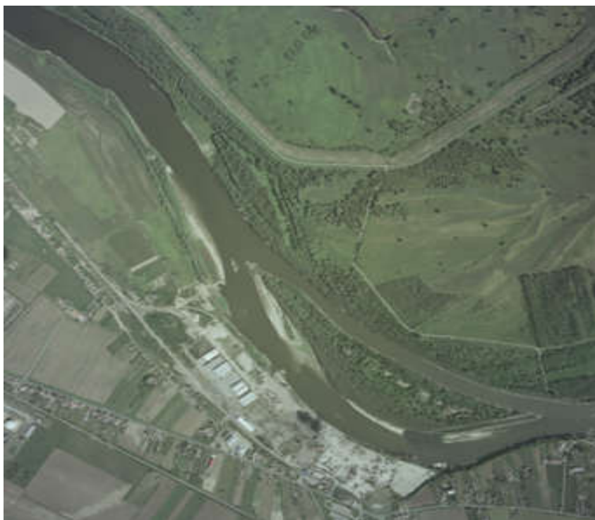
Slika 9. Prokop Nemetin na rijeci Dravi 1986. godine [18]