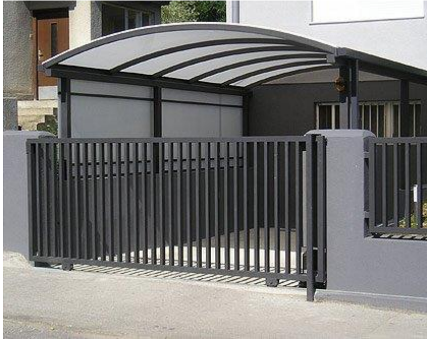
Slika 13. Bravarski radovi kod ograde [9]