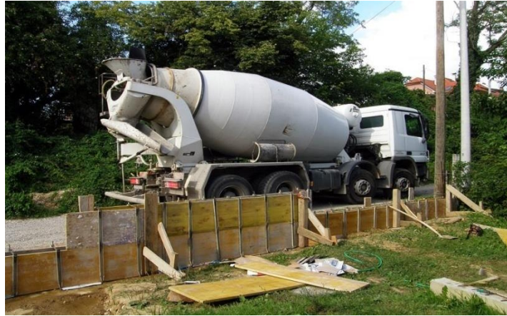
Slika 4. Betonski radovi [3]