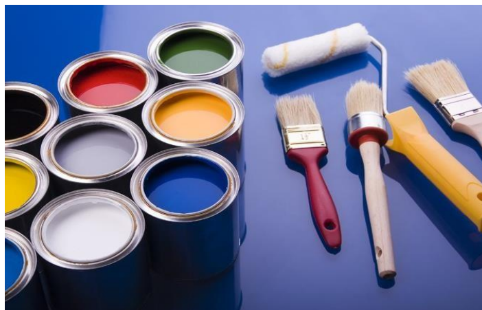
Slika 19. Materijal za ličilačke radove [12]