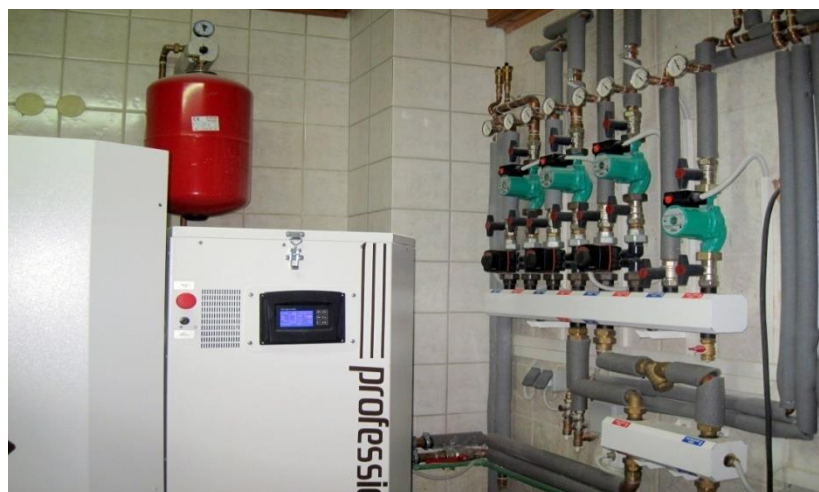
Slika 21. Kotlovnica [2]