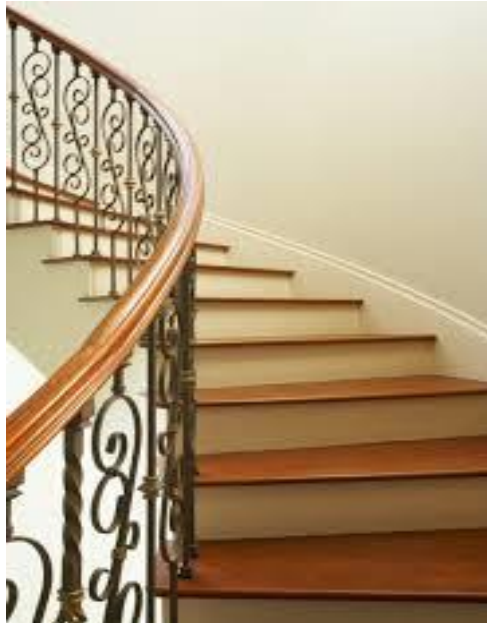
Slika 15. Stolarski radovi kod stepeništa [10]