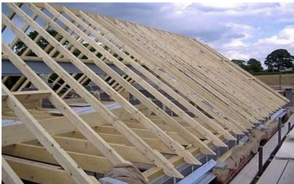
Slika 6. Postavljanje krovišta [5]