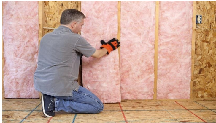
Slika 8. Postavljanje termoizolacije [6]

U ovisnosti o uporabljenom polaznom materijalu za proizvodnju treba dosta energije. To svakako treba uzeti u obzir kod odabira termoizolacijskih materijala. Termoizolacijski materijali se razlikuju kao sintetski (umjetni) izolacijski materijali, prirodni odnosno termoizolacijski materijali slični prirodnim kao i više slojni izolacijski materijali.