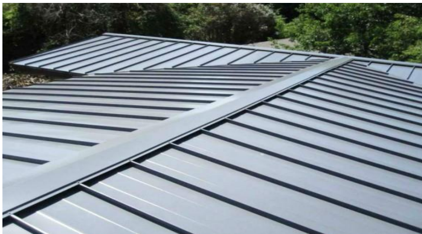
Slika 11. Primjer krovišta sa limom [8]

Na tržištu se nudi dosta krovne opreme i krovne limarije koja udovoljava većini potreba, no bolje je da izvedbu radova prepustite limarima, krovopokrivačima ili tvrtkama specijaliziranim isključivo za proizvodnju i montažu građevinske krovne limarije. [8]