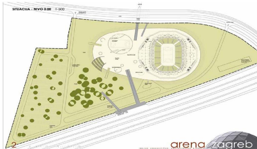
Slika 2. Primjer idejnog projekta (situacije) [3]

Idejni projekt, ovisno o vrsti građevine, sadrži: