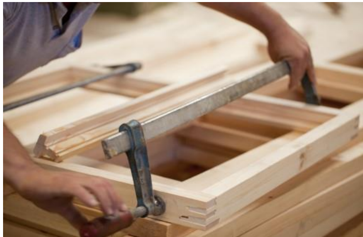
Slika 14. Stolarski radovi [10]