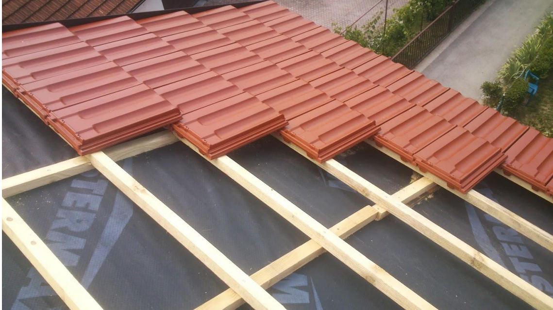
Slika 10. Pokrivanje krovišta sa crijepom [7]

(rubovi krova, uvale, grebeni, sljeme krova, zidovi, itd.) ili kod krovnih prodora (dimnjaci, prozori, instalacije, itd.). [7]