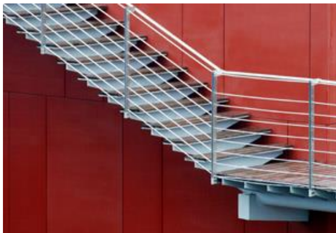
Slika 12. Bravarski radovi kod stepeništa [9]