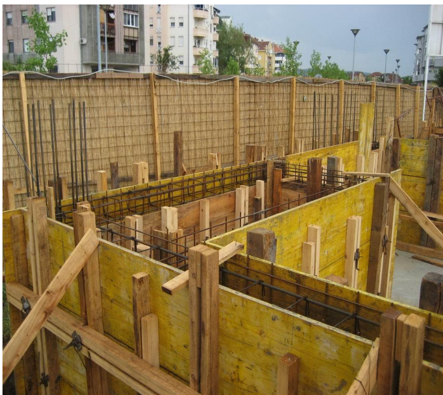
Slika 7. Postavljanje oplata za betoniranje zidova [5]