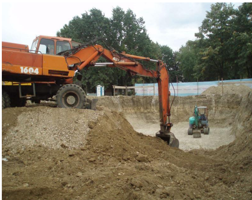
Slika 3. Zemljani radovi [3]