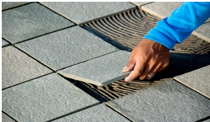
Slika 16. Postavljanje keramičkih pločica [11]

Bušilica s odgovarajućim dodatkom (nastavkom) za miješanja smjese u ovom slučaju može biti od velike pomoći. Na kraju miješanja smjesa mora biti "kašasta" - a to znači niti previše rijetka niti previše gusta. Nakon pripreme smjesu nanosimo na podlogu - pod ili zid - a nanosimo je na manje površine kako bismo spriječili njezino prijevremeno sušenje. [11]