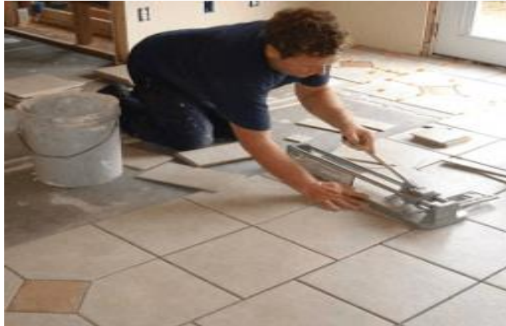
Slika 17. Postavljanje keramičarskih pločica [11]