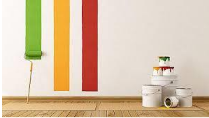
Slika 18. Soboslikarski radovi (bojanje zidova u boji) [12]