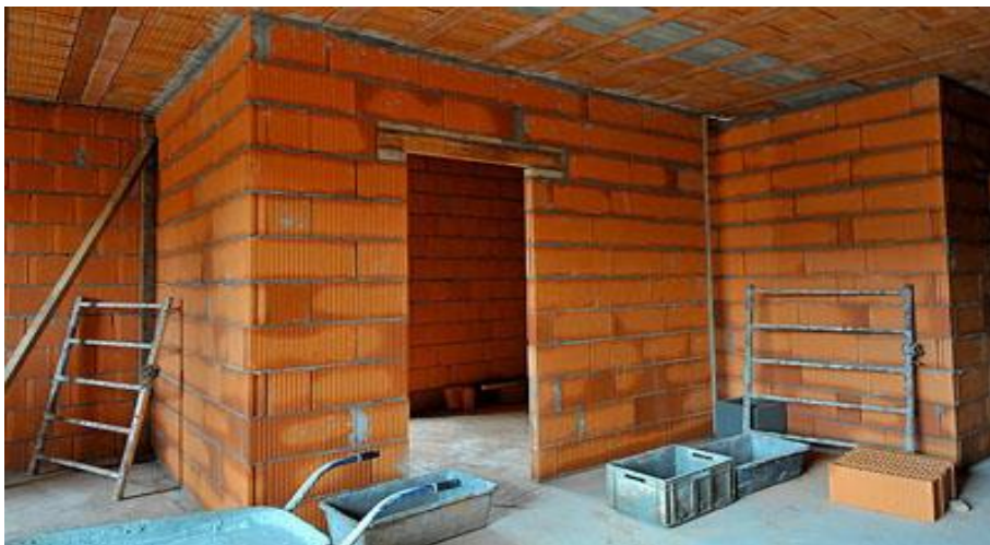
Slika 5. Zidarski radovi [4]

Zidanje započinje postavljanjem kuta, odnosno elemenata za vertikalni serklaž, ukoliko se građevina zida s vertikalnim serklažima. Između kutova slaže se opeka do opeke a ravnost se postiže pomoću građevinskog konopa i libele. Ako je potrebno dodatno poboljšati toplinsku kvalitetu zida, može se zidati predgotovljenim toplinskim mortom koji se kupuje u skladištima građevinskog materijala. [4]