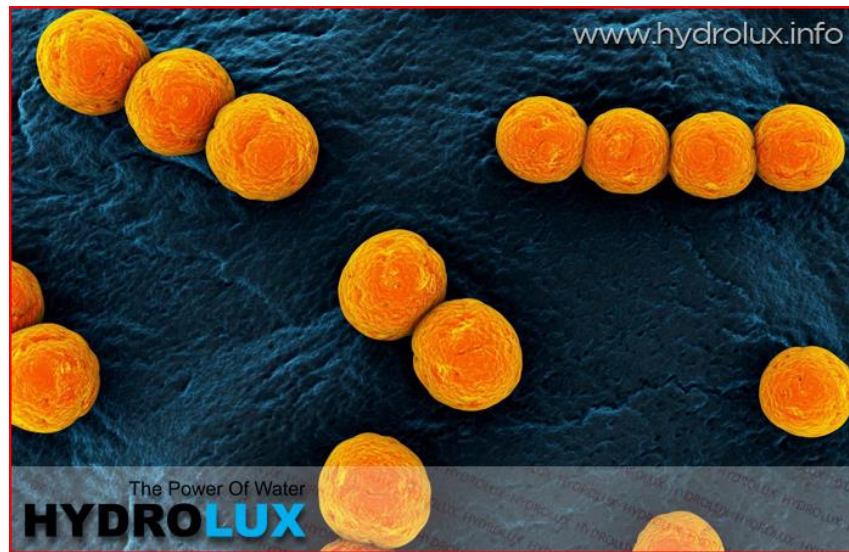
Slika 3. Prikaz kuglastih bakterija enterokoka

Jako su rasprostranjeni u okolišu, a nalaze se u fekalijama kralježnjaka. Negativna strana indikatorske vrste je da se enterokoki ne mogu opaziti zbog ugibanja u okolišu, ako je temperatura veća od 55°C [8].