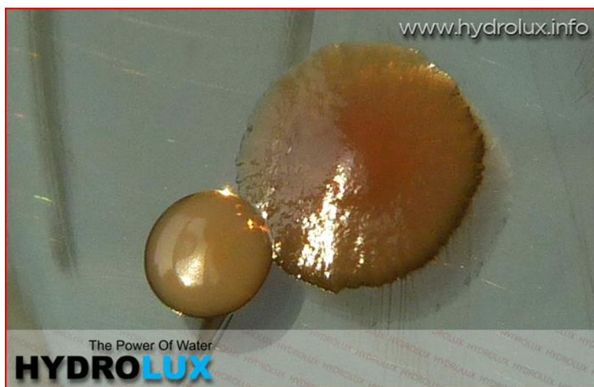
Slika 5. Prikaz kolonije bakterija Pseudomonas aeruginosa

Bakterija Pseudomonas aeruginosa pokazatelj je fekalnog onečišćenja i neadekvatnog vodovodnog sustava u objektima koji predstavljaju opasnost po zdravlje osjetljive populacije (djeca, trudnice, starije osobe). Izgled kolonija bakterija Pseudomonas aeruginosa može se vidjeti na slici 5. Pseudomonas je čest uzročnik infekcije kože i uha u bazenima i kontaminant voda u bocama što može dovesti do oboljenja kod osjetljivih populacija [8].