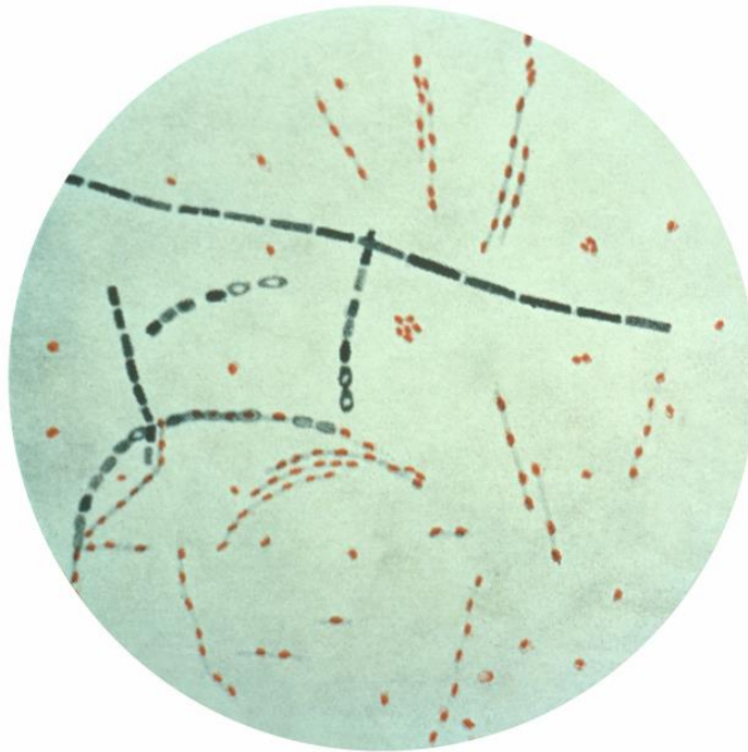
Slika 6. Prikaz bakterije Bacillus anthracis

proživljavaju nepovoljne uvijete u okolišu. Na slici 6. može se vidjeti prikaz bakterije Bacillus anthracis [10].