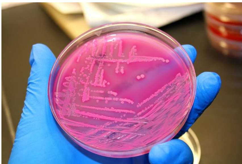
Slika. 2. Kolonije Echerichia coli na hranjivoj podlozi u Petrijevoj zdjelici

Escherichia coli je dominantna bakterijska vrsta u crijevima i fecesu. Kao primarni ili sekundarni uzročnik može uzrokovati različita patološka stanja u ljudi i životinja. Rasprostranjena je u okolišu. Životinje svakodnevno putem hrane i vode dolaze u dodir sa njom. Fiziološki se nalazi u probavnom sustavu svih toplokrvnih životinja i ljudi, a pod određenim uvjetima uzrokuje kolibacilozu. Kolibaciloza se opisuje infekcijom bakterije E. coli koja se očituje upalnim promjenama u crijevu ili drugim organima te septikemijom i koliseptokemijom. Enterohemoragični (EHEC) sojevi E. coli mogu izazvati bolest u teladi, a često se nalaze u životinjama bez kliničkih simptoma te u njihovim izlučevinama i okolišu. Taj serovar (naziv za grupu mikroorganizama ili virusa koji imaju zajedničke antigene na svojoj površini) se u humanoj medicini smatra osobito patogenim, a u čovjeka može prouzročiti proljeve, hemolitičkoureemični sindrom, hemoragične kolitise i druge komplikacije. Kako izgledaju kolonije Echerichia coli na hranjivoj podlozi u Petrijevoj zdjelici možemo vidjeti na slici 2 [5].