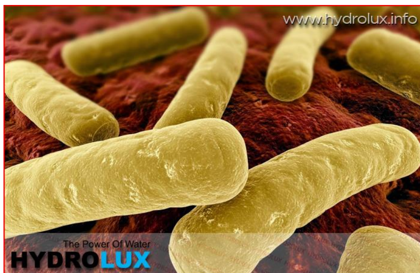
Slika 4. Prikaz štapićaste bakterije Clostridium perfringens

Bakterije roda Clostridium su jako rasprostranjene u prirodi. One su štapićastog oblika što možemo vidjeti na slici 4. Većine vrsta produciraju egzotoksine i patogene su za čovjeka i životinje zbog primarne infekcije ili potencijalne apsorpcije egzotoksina. Clostridium perfringens je jedna od čestih patogenih klostridija. Izvori zaraza (plinska gangrena, sekundarne infekcije rana, enteritis, sepsa) su probavni sustav već zaraženih ljudi i životinja. Preko fecesa bakterija dolazi u vodu, zemlju, i živi organizam.