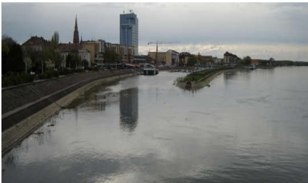
Slika 10. Nasip rijeke Drave kod Osijeka [19]