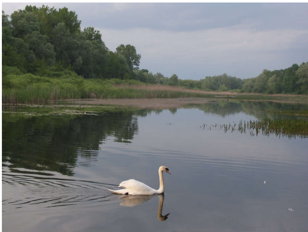
Slika 8. Stara Drava kraj Lepe Grede [17]