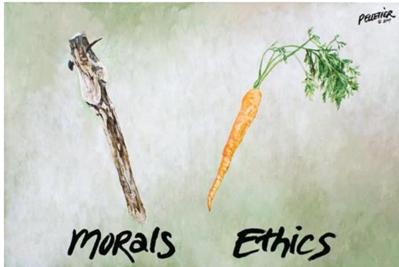
Slika 2: Slikovit prikaz odnosa morala i etike [9]

Etika i etičko ponašanje pojedinaca, a time i društva je jezgra svakog održivog sustava, pa tako i tehničkih struka. Uloga inženjera u razvoju materijalne osnove društva je važna na više načina, ali i podložna etičkim promišljanjima i kritici o značaju i utjecaju tehnologije. Prevladavajuće mišljenje društva je da su etika i moral u akademskoj zajednici sami po sebi razumljivi i nema ih potrebe posebno isticati u okviru tehničke izobrazbe.