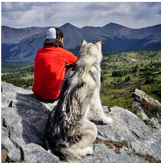
Slika 1. Čovjek i prirodni svijet [5]

Gledajući kroz prošlost vidljivo je da s razvojem čovjeka i njegovih potreba dolazi do uništavanja prirode i okoliša. Promatrajući urbanizaciju tijekom povijesti vidljivo je kako je čovjek zbog potrebe za mjestom stanovanja malo po malo oblikovao okoliš po svojoj potrebi, najprije u neznatnoj mjeri, a kasnije sve intenzivnije.