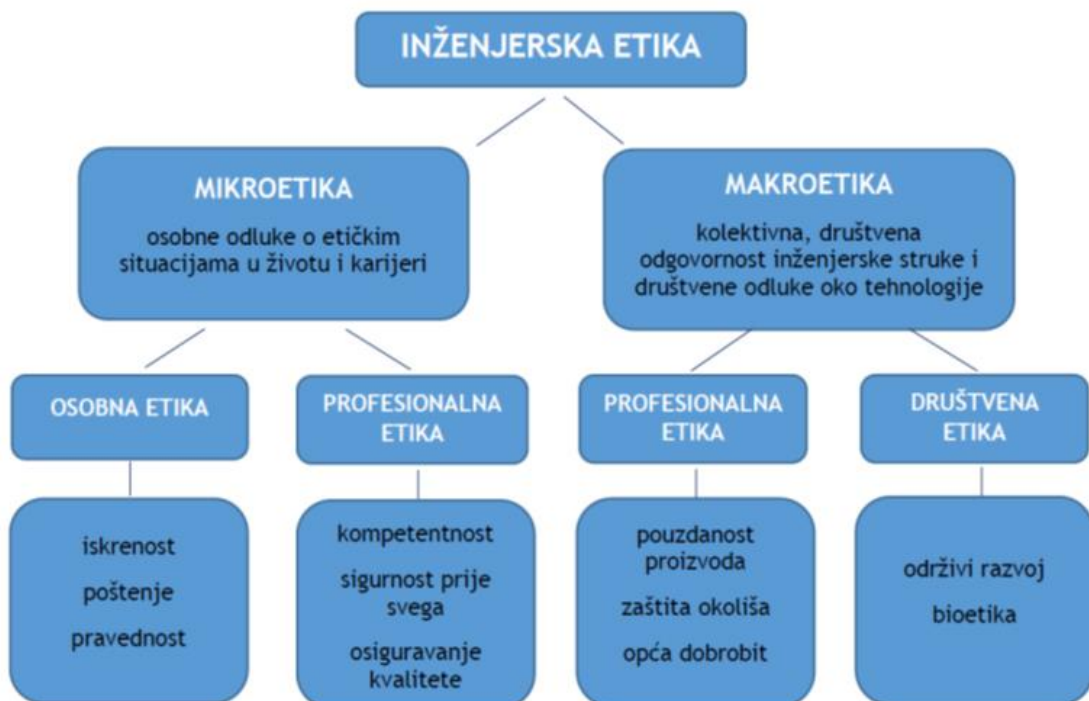
Slika 3: Sumarni i slikoviti prikaz inženjerske etike [3]

Inženjerska etika može se razmatrati na više razina i s više različitih gledišta (slika 3).