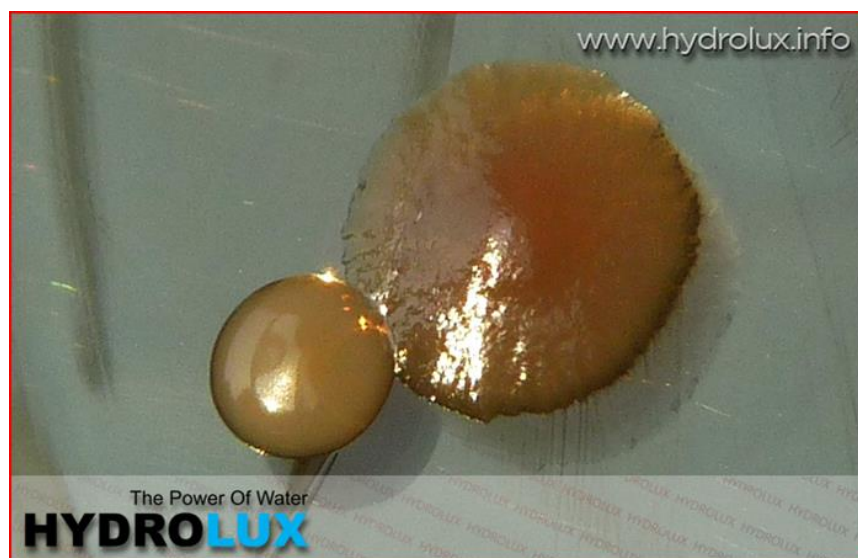
Slika 5. Prikaz kolonije bakterija Pseudomonas aeruginosa

Bakterija Pseudomonas aeruginosa pokazatelj je fekalnog onečišćenja i neadekvatnog vodovodnog sustava u objektima koji predstavljaju opasnost po zdravlje osjetljive populacije (djeca, trudnice, starije osobe). Izgled kolonija bakterija Pseudomonas aeruginosa može se vidjeti na slici 5. Pseudomonas je čest uzročnik infekcije kože i uha u bazenima i kontaminant voda u bocama što može dovesti do oboljenja kod osjetljivih populacija [8].