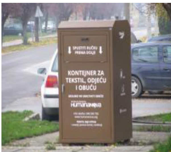
Slika 6. Ulični spremnik za sakupljanje tekstila [13]

Iznimku predstavljaju specijalizirani spremnici, postavljeni na nadziranim površinama, gdje se sprječava nekontrolirano odlaganje drugih kategorija otpada (npr. Specijalizirani spremnici postavljeni u okviru trgovačkih centara, vrtića, škola ili drugih javnih ustanova). Na spremniku mora stajati natpis kako se prikuplja isključivo tekstil koji je moguće ponovno uporabiti.