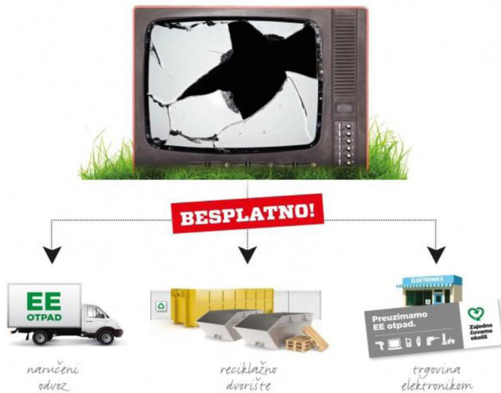
Slika 8. Prikaz načina sakupljanja EE opreme/otpada [17]