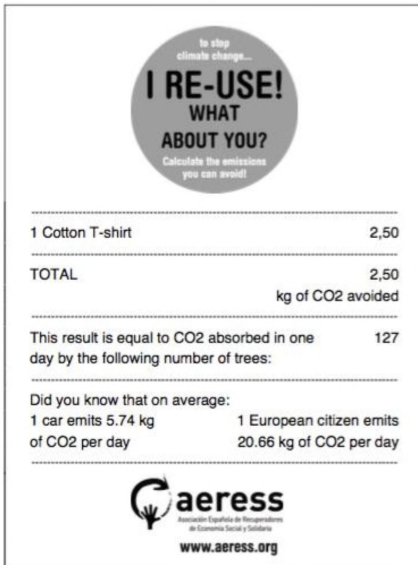
Slika 7. Količina emisija CO 2 izražena u kg koja se izbjegne ponovnom uporabom jedne pamučne majice [15]

U svrhu rješavanja problema tekstilnog otpada unutar sektora tekstilne industrije razvijaju se brojne inicijative kojima je cilj smanjiti negativan utjecaj na okoliš i zajednicu, a jedna od mjera je i uporaba tekstila. Moguće je čak i 90 % tekstilnog otpada ponovno iskoristiti, oporabiti ili reciklirati.