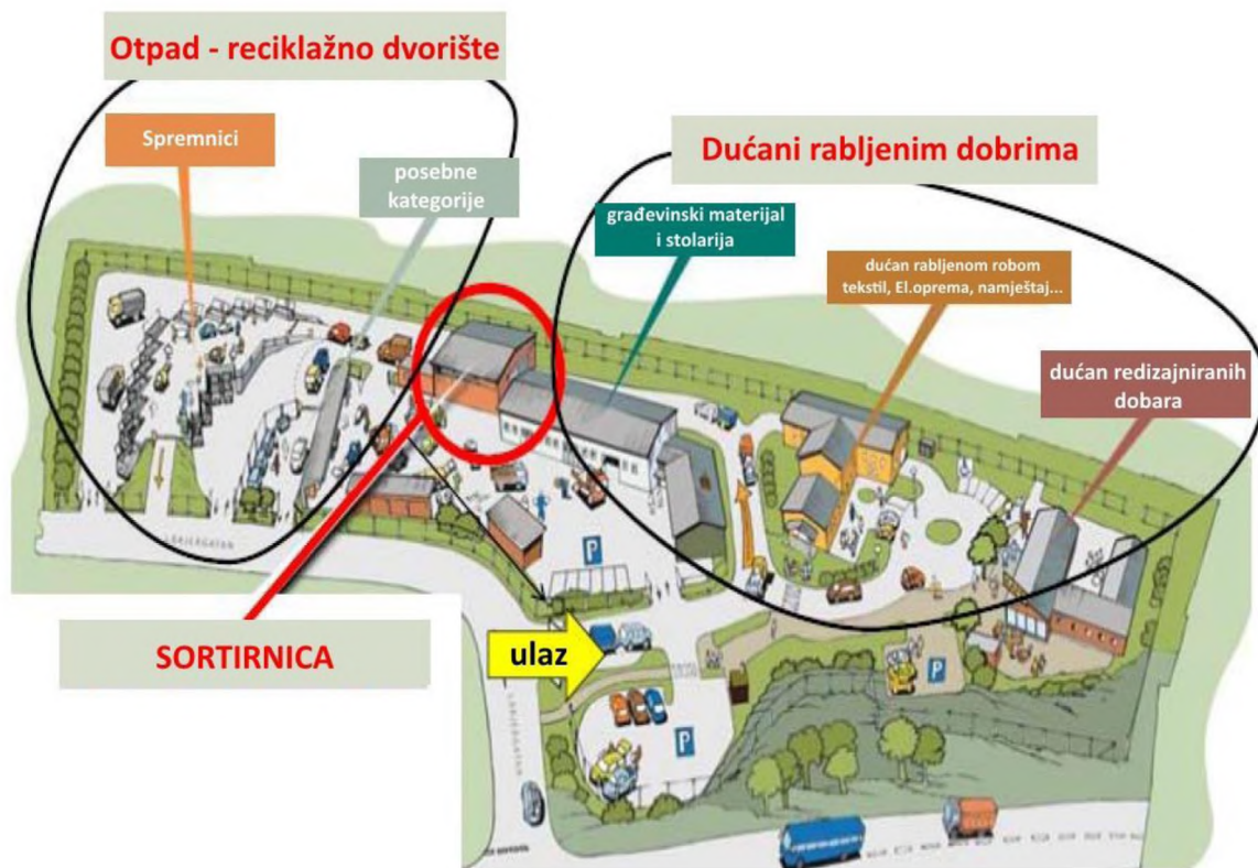
Slika 4. Primjer „eko parka“ u gradu Göteborgu u Švedskoj [1]

Minimalna površina potrebna za izgradnju CPU iznosi 1.300 m 2 , od čega 500 m 2 treba biti natkriveno kako bi se mogle odvijati aktivnosti primitka predmeta. Također, tu bi se nalazile radionice za popravak i spremišta, a poželjno bi bilo izgraditi i nadstrešnicu ispod koje bi se mogle organizirati razmjene i sezonske rasprodaje iskoristivih stvari i proizvoda. [1]