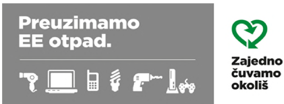
Slika 9. Oznaka o obvezi preuzimanja EE otpada [17]