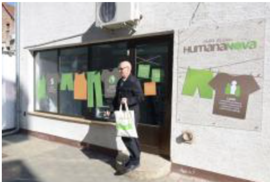
Slika 13. Trgovina Socijalne zadruge Humana Nova u Čakovcu [22]

Socijalna zadruga Humana Nova bavi se proizvodnjom i prodajom kvalitetnih i inovativnih tekstilnih proizvoda od ekoloških i recikliranih materijala za domaća i inozemna tržišta. Jedna je u nizu od društvenih poduzeća koja se razvijaju na području Međimurske županije od strane Autonomnog centra – ACT. Prva trgovina otvorena je u Čakovcu, a potom je otvorena i u Zagrebu (Slika 13. i 14). [21, 22, 23]