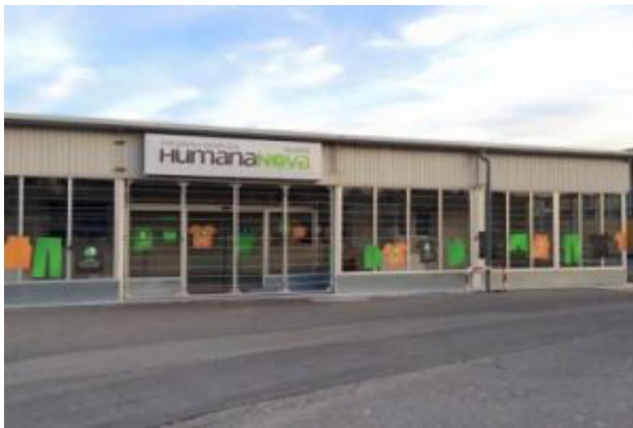
Slika 14. Trgovina Socijalne zadruge Humana Nova u Zagrebu [23]

Socijalna zadruga predstavlja društveno poduzeće koje potiče zapošljavanje osoba s invaliditetom i drugih društveno isključenih osoba te na taj način doprinosi izgradnji društva tolerancije i suradnje, pomaže socijalno isključenim osobama i njihovim obiteljima te na taj način unaprjeđuje njihovo samopouzdanje i kvalitetu života. Također doprinosi održivom razvoju lokalne zajednice, smanjenju siromaštva i očuvanju prirode.