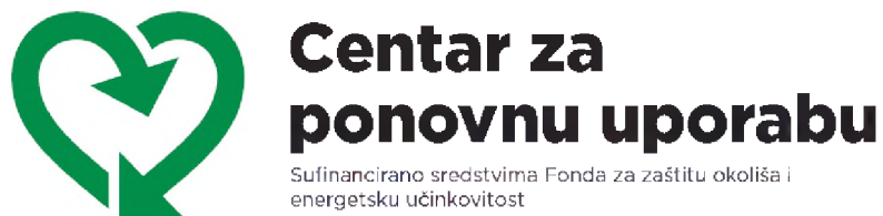
Slika 2. Oznaka centra za ponovnu uporabu [1]