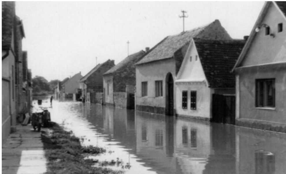
Slika 5. Poplava rijeke Drave u Osijeku 1965. godine [14]

Osijek-Bilje (Slika 5) te se stvorilo jedinstveno jezero nastalo od dotoka dravske i dunavske vode. Mjere obrane od poplava ukinute su 21. srpnja 1965. godine. Posljedice poplave iz 1965. godine (koja je trajala 105 dana) su da je na području tadašnjega kotara Osijek bilo poplavljeno 56 381 ha zemljišta, ugrožena su bila 82 naselja s 35 000 stanovnika, poplavljeno je 3448 stambenih objekata, srušen 1371 objekt, te je uništeno 16 km kanalizacijske mreže, 42 km parovoda i vodovodne mreže te cesta u dužini od 52 km. Velike štete zabilježene su i na području Valpova, Donjega Miholjca, Slatine, a značajno je stradao i tadašnji PIK Belje [7].