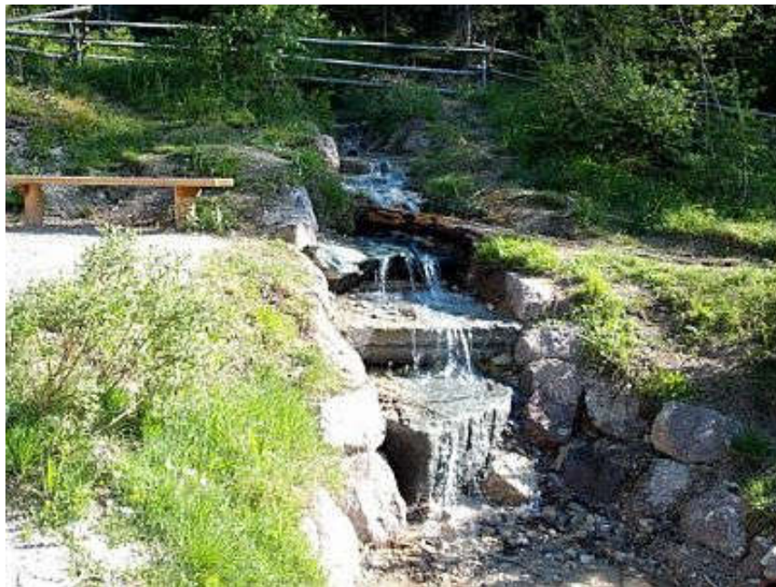
Slika 2. Izvor rijeke Drave [3]

Izvor rijeke Drave nalazi se u planinskom lancu Dolomiti di Sesto (Slika 2). Izvor je u blizini jezera Dobbiaco (Toblach) u Italiji, na 1450 metara nadmorske visine. Rijeka teče prema istoku kroz Austriju (Tirol i Korušku). Tamo je sastavni dio Dravske doline, najduže uzdužne doline u Alpama. Odande teče jugoistočno kroz Sloveniju, vijuga kroz Hrvatsku i jug Mađarske gdje tvori granicu između dviju zemalja. Zatim konačno doseže Dunav u blizini grada Osijeka [1].