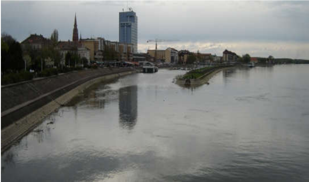
Slika 10. Nasip rijeke Drave kod Osijeka [19]