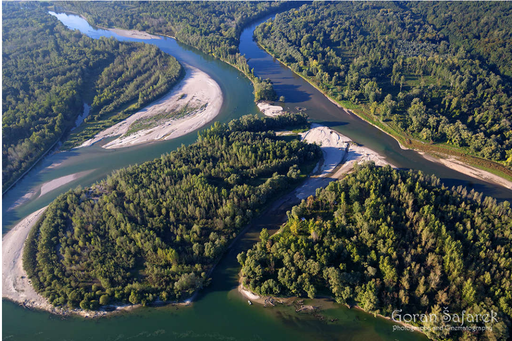
Slika 3. Rijeka Drava snimljena iz zraka [5]

Na području dravskog sliva smješteno je oko 970 naselja u kojima živi oko 830 000 stanovnika. Uglavnom prevladavaju manja naselja, a od većih gradova izdvaja se Osijek (108 000 stanovnika) i Varaždin (49 000 stanovnika). Oko 63% sliva su poljoprivredne površine sa znatno manjim udjelom šuma (25%) [6].