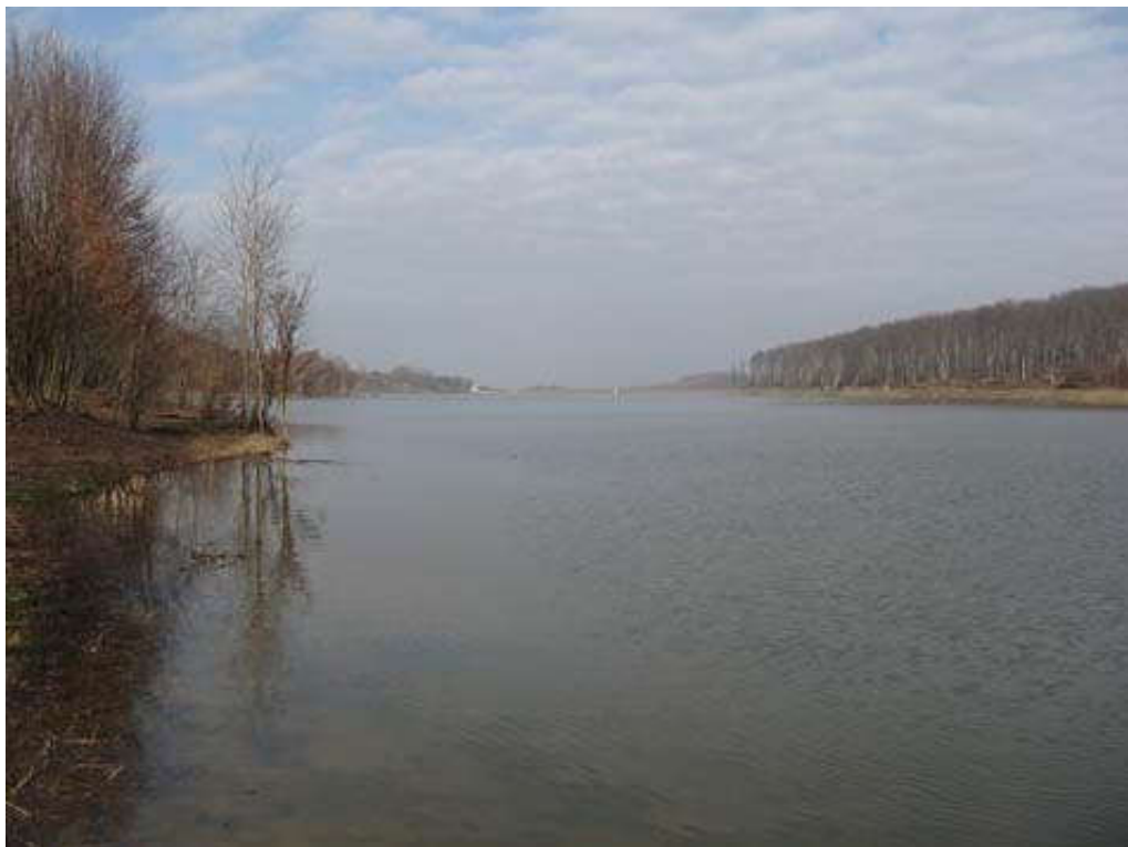
Slika 11. Akumulacija Lapovac 2 [20]

Na slivnim područjima donje Drave izgrađene su do danas dvije akumulacije: Lapovac II (Slika 11), volumena 2,41 \times 10^6 \text{ m}^3 na slivnom području Karašica-Vučica i akumulacija Borovik na slivnom području Vuke (volumena 8,6 \times 10^6 \text{ m}^3 ) te 11 retencija na slivnom području Županijski kanal. U budućnosti se planira izgraditi još ukupno 40 što akumulacija što retencija kojima bi se, uz poboljšano održavanje sustava odvodnje, postigao zadovoljavajući stupanj zaštite ovog dijela vodnoga područja od brdskih voda. Koliko su akumulacije i retencije značajne u zaštiti od poplava najbolje se moglo vidjeti 2001. godine kada su velike količine oborina uzrokovale velike štete u Slavoniji, ali ne i na području VGI Županijski kanal (sa sjedištem u Virovitici) gdje je izgrađeno 11 retencija [7].