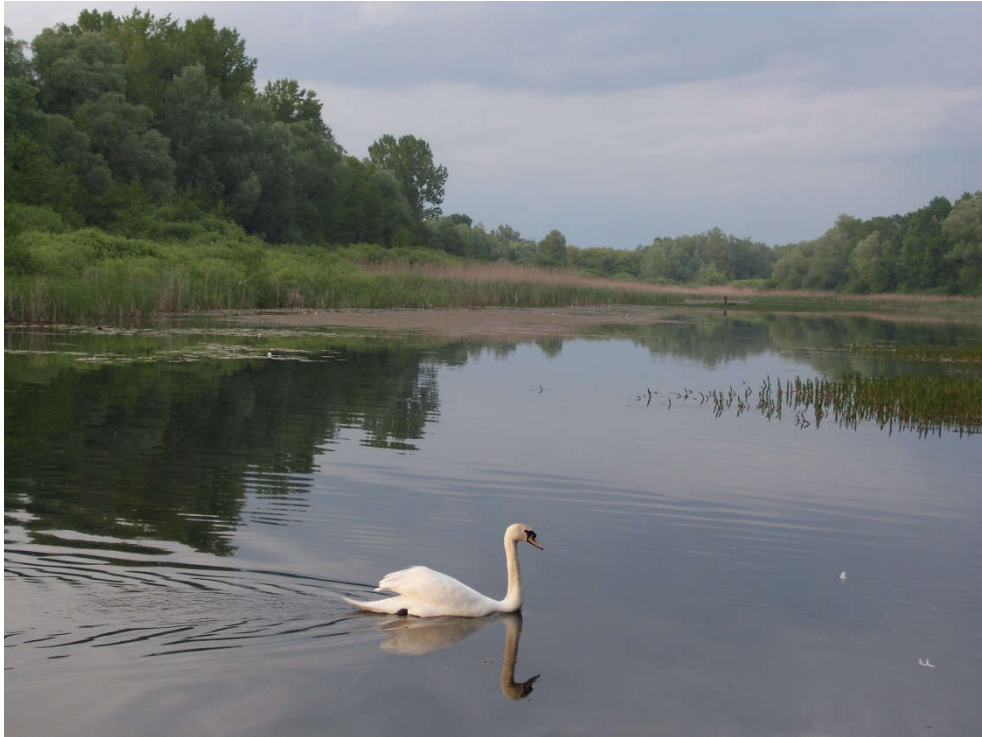
Slika 8. Stara Drava kraj Lepe Grede [17]