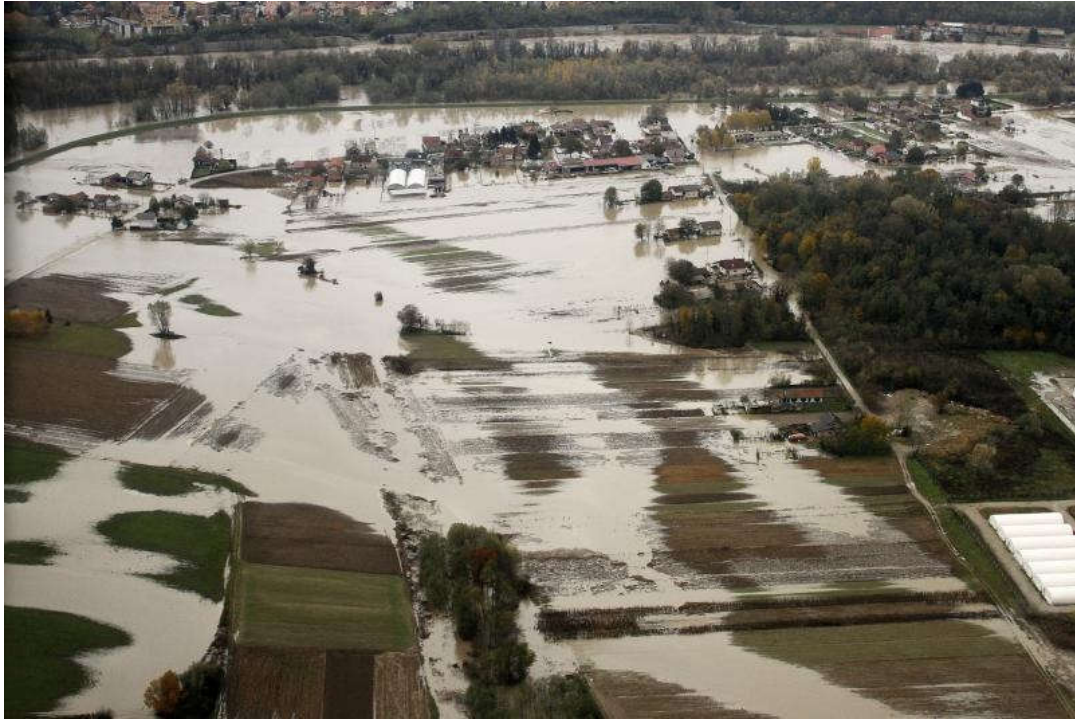
Slika 7. Poplava rijeke Drave u Varaždinskoj županiji 2012. godine [16]