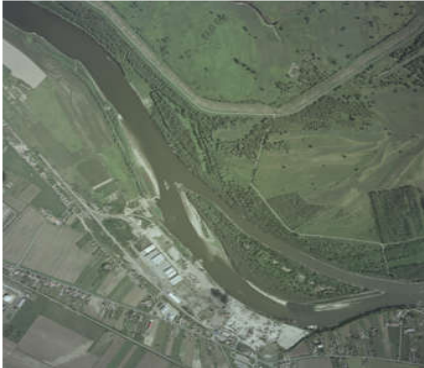
Slika 9. Prokop Nemetin na rijeci Dravi 1986. godine [18]