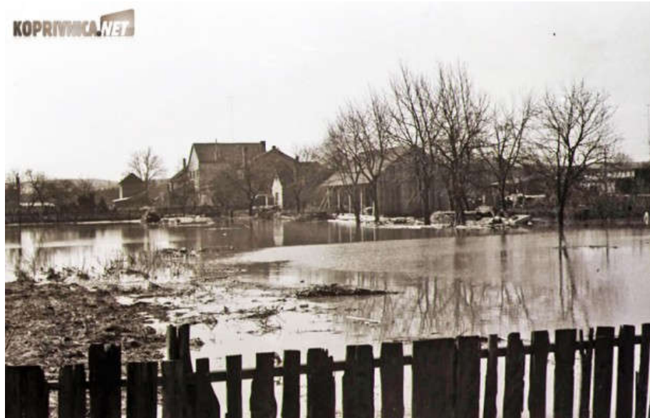
Slika 6. Poplava rijeke Drave u Podravini 1972. godine [15]

Poplave iz 1972. godine (Slika 6) po svom opsegu i štetama premašile su i katastrofalnu poplavu iz 1965. godine. Tada je poplavama bilo ugroženo cijelo vodno područje od Varaždina do Osijeka, ukupno 87000 ha površina [7].