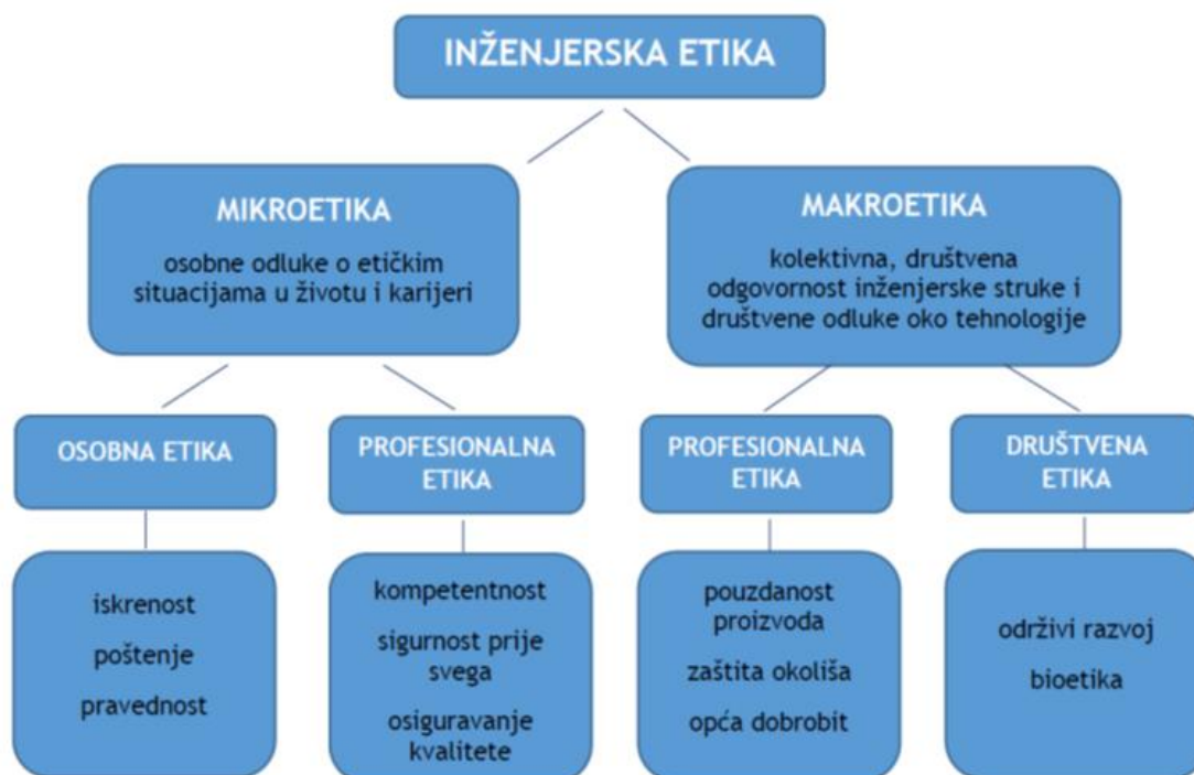
Slika 3: Sumarni i slikoviti prikaz inženjerske etike [3]

Inženjerska etika može se razmatrati na više razina i s više različitih gledišta (slika 3).