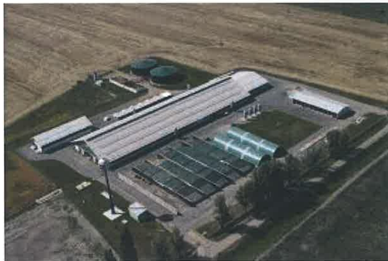
Slika 1. Izgled uređene peradarske farme sa svim potrebnim objektima [6]

vodonepropusne, izolirane i pokrivene poklopcima za sprječavanje ulaska oborinskih voda i širenja onečišćenja. Potreban je i prostor za odlaganje uginulih životinja u skladištenje opasnog otpada koji prema propisima procjene utjecaja na okoliš mora ispunjavati uvjete da se u najvećoj mogućoj mjeri spriječi onečišćenje okoliša raznošenjem, ispuštanje i razlijevanjem otpada, da je spriječeno istjecanje oborinske vode koja dolazi u doticaj s tlom, podzemnom vodom i morem, da je građevina natkrivena pa je tako spriječen dotok oborinskih voda na otpad, da su spremnici za odlaganje opasnog otpada građeni od materijala otpornog na djelovanje uskladištenog otpada na način koji osigurava sigurno punjenje, pražnjenje, odzračivanje, uzimanje uzoraka te po potrebi nepropusno zatvaranje (Slika1.) [5].