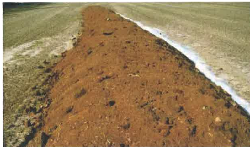
Slika 6. Neprikladno odlaganje gnojiva na oranici [13]

Tlo je neobnovljiva prirodna vrijednost pa iziskuje naročitu pažnju tijekom korištenja i brigu o plodnosti, strukturi, eroziji i onečišćenju te drugim oblicima kakvoće [21]. Već samom izgradnjom peradarske farme se nepovratno izgubi jedan dio tla na kojem je izgrađena. Uz to, poljoprivredni otpad je velika opasnost za tlo. Otpad, po samoj definiciji predstavlja svaku materiju ili predmet koji vlasnik odlaže, namjerava odložiti ili ga namjerava prestati koristiti. U poljoprivredni otpad ubraja se: otpad od strojeva i mehanizacije, plastika, plastične ambalaže (od pesticida, mineralnih gnojiva i dr.), veterinarski proizvodi, građevinski otpad, karton i papir, metal, drvo, staklo, gume, pepeo, životinjski otpad i žetveni ostaci [8]. Gnojivo peradi poboljšava strukturu u tlu, osigurava hranjive tvari za biljke, ali prekomjerno gnojenje peradarskim gnojivom znatno mijenja pH tla što šteti biljkama. Dodatni negativni utjecaj na tlo nastaje kada se gnojivo odlaže na iste poljoprivredne površine uzastopno više od 5 godina, jer svako tlo ima određeni kapacitet prihvata gnojiva. Stoga je važno da se dozrijeli pileći gnoj odvozi na oranice, zaorava te koristi kao gnojivo prema mjerodavnim propisima da bi se moguće onečišćenje štetnim tvarima spriječilo ili barem minimaliziralo. Dugo skladištenje gnojiva povećava količinu dušika, a time se povećava zaliha dušika koja je iz tla dostupna usjevima (Slika 6.).