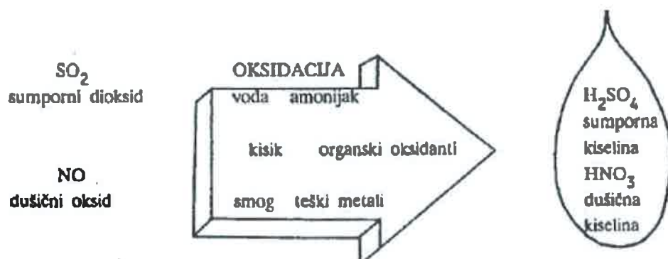
Slika 5. Nastajanje sumporne i dušične kiseline u atmosferi [20]