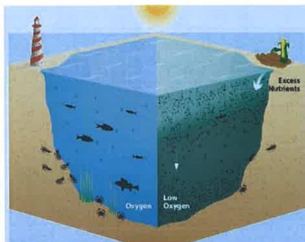
Slika 3. Posljedice viška hranjivih tvari u vodi [13]

Dušik kao hranjiva tvar prirodno kruži kroz okruženje u raznim oblicima i pomaže u održavanju biljaka i životinjskih života, no njegov višak uništava život pod vodom (Slika 3.).