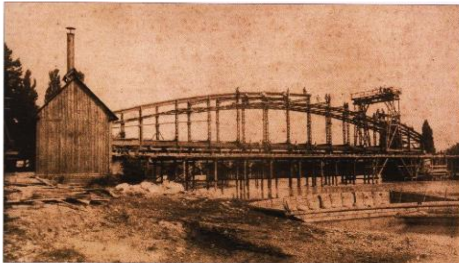
Slika 5. Izgradnja željezničkog mosta na Dravi, Varaždin 1885. [5]

U zemljama Habsburške Monarhije u drugoj polovici 18. stoljeća sve više se počeo ubrzavati razvoj gospodarstva i trgovine. Kako je Varaždin bio na povoljnom trgovačkom pravcu prema jugu i tu se promet počeo znatno povećavati. Tako je 1782. godine car Josip II. naredio Kraljevskom namjesničkom vijeću da na Dravi kod Varaždina podignu stalan drveni most. Zbog tog mosta je Varaždin 1786. godine posjetio i Josip II. Drveni most je bio često poplavljen, stoga je 1834. godine izgrađen novi drveni most, ali je i on stradao. Drveni most je trajao skoro do kraja 19. stoljeća točnije do listopada 1898. godine kada je srušen. Istočno od drvenog mosta sagrađen je i željeznički most (Slika 5.) koji je omogućio stalnu vezu Čakovca sa Zagrebom. Most je srušen tijekom Drugog svjetskog rata te ponovno uspostavljen tek 1953. Zbog sve većeg povećanja cestovnog prometa te rekonstrukcije ceste Varaždin – Čakovec, sagrađen je cestovni most koji je i danas u funkciji [5].