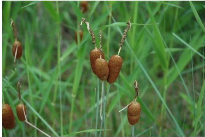
Slika 13. Patuljasti rogoz ( Typhaminima )[19]

Patuljasti rogoz ( Typhaminima ) (slika 13) je još jedna od ugroženih biljaka. U prošlosti je bila veoma česta riječna biljka, međutim zbog ljudskog djelovanja je izumrla (gradnja hidroelektrana, regulacija tokova). Kako bi se populacija ovih biljaka povećala provest će se različite mjere upravljanja te različiti programi ponovnog uvođenja u okoliš [17].