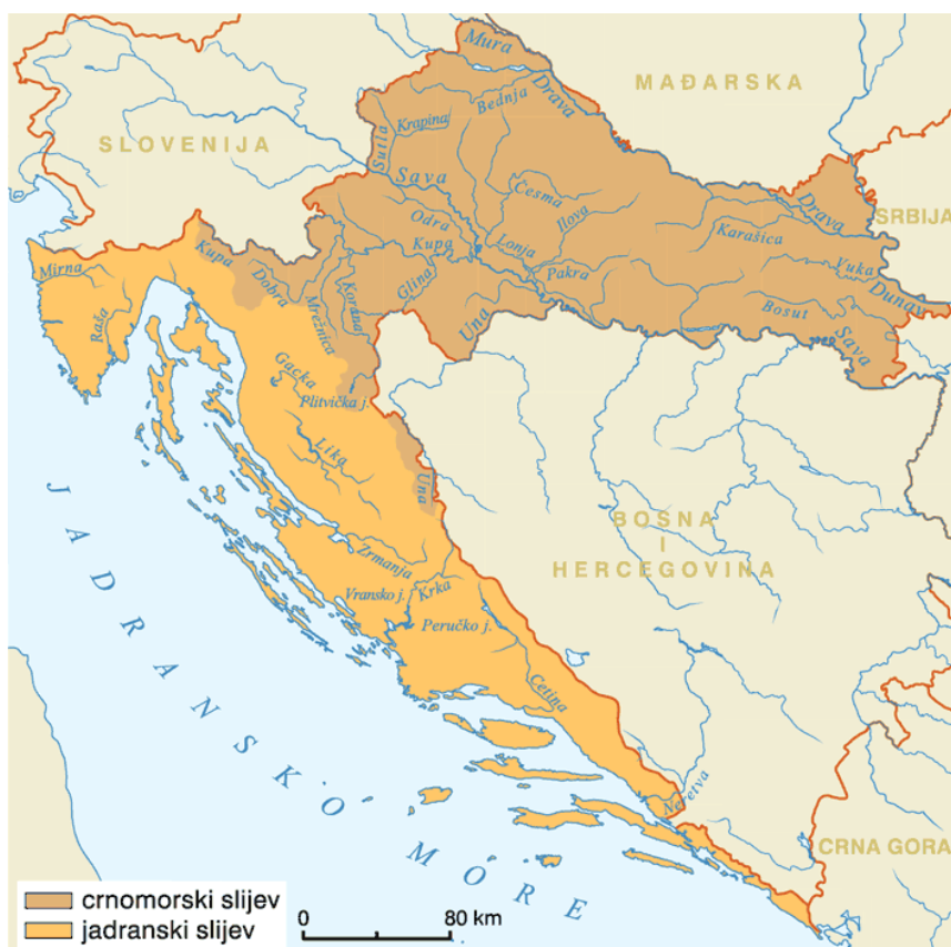
Slika 1. Zemljopisni položaj rijeke Drave u Hrvatskoj [2]

Rijeka Drava dugačka je 725 km i povezuje alpska područja Italije, Austrije i Slovenije s panonskim područjima Hrvatske i Mađarske. Dionica kroz Hrvatsku je dužine 322,8 km (Slika 1). Ona je ujedno i jedan od najvećih pritoka Dunava, a ove dvije rijeke zajedno s Murom čine veliko europsko riječno područje. Rijeka Drava je isto tako i okosnica planiranog UNESCO-ova Prekograničnog rezervata biosfere „Mura – Drava – Dunav“, koji će nakon osnivanja biti najveće europsko zaštićeno riječno područje (700 km) te će biti prvi svjetski pentalateralni (Hrvatska, Austrija, Mađarska, Slovenija i Srbija) UNESCO-ov rezervat biosfere [1].