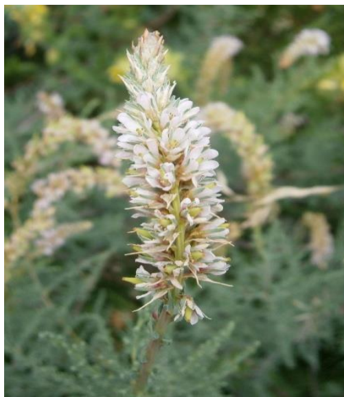
Slika 12. Kebrač ( Myricariagermanica ) [18]

Kao što je ranije navedeno Jadranska kozonoška jedna je od ugroženih biljaka na području rijeke Drave. Kebrač ( Myricariagermanica ) (Slika 12) je isto tako jedna od najugroženijih biljnih vrsta na području rijeke. Nalazi se samo u dva područja na ušću Mure u Dravu kod Legrada, a ta područja su dom jedine prirodne populacije u Hrvatskoj. Iz tog razloga je očuvanje ove vrste od iznimne važnosti [17].