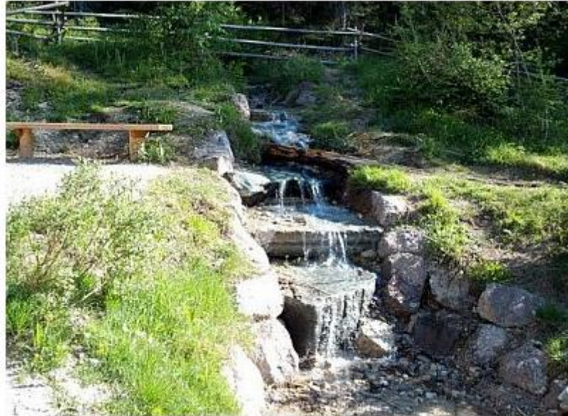
Slika 2. Izvor rijeke Drave [3]

dio Dravske doline, najduže uzdužne doline u Alpama. Od tuda rijeka teče jugoistočno kroz Sloveniju, nastavlja svoj put kroz Hrvatsku i jug Mađarske, gdje stvara granicu između dviju država. Na kraju se ulijeva u Dunav u blizini grada Osijeka.