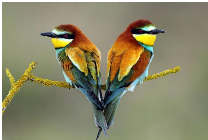
Slika 14. Žute Pčelarice ( Merops apiaster ) [20]

Drava je dom mnogim vrstama ptica kao što su mala čigra ( Sternula albifrons ), obična čigra ( Sterna hirundo ), mala prutka ( Actitis hypoleucos ) i kulik sljepčić ( Charadrius dubius ). S obzirom da se ove ptice gnijezde u šljunku i pijesku, područje oko Drave je idealno za njih. Staništa kao što su prirodne strme obale su dom bregunice ( Ripariaria riparia ), žute pčelarice ( Merops apiaster ) (slika 14) i vodomara ( Alcedo atthis ). U ovom području još se nalaze i Orao štekavac ( Haliaeetus albicilla ) i crna roda ( Ciconia nigra ). Sve ove ptice nalaze se u velikoj opasnosti zbog toga što se njihova populacija smanjuje ili zbog gubitka staništa ili zbog loše kvalitete staništa, što je uzrokovano regulacijom rijeke i štetnim ljudskim djelovanjem [17].