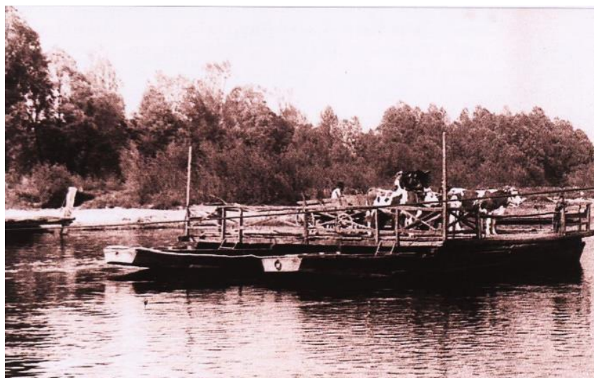
Slika 4. Skela na Dravi [5]

Kao što je ranije navedeno stoljećima na Dravi nije bilo mostova, nego je brodom točnije skelom (Slika 4) upravljao predstavnik države, varaždinski župan koji je ubirao određene pristojbe. Krajem 16. stoljeća Gradska općina Varaždina htjela je steći gospodarsko – trgovačku neovisnost o županu te imati vlastiti prijevoz. Međutim do toga nije došlo te se prijevoz preko Drave nije promijenio. Skela kao način prometovanja koristila se i u 20. stoljeću nakon što su njemačke mine razorile most [5].