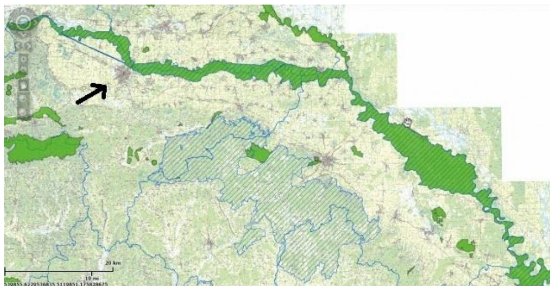
Slika 11. Ekološka mreža Natura 2000 – Drava [16]

Rijeka Drava je cijelim svojim tokom uključena u Natura 2000 područje što je dokaz njezine iznimne važnosti. Isto tako na stanicama Bio portala vidljivo je koja su sve područja u Hrvatskoj obuhvaća Naturom 2000. među ostalom dostupni su i podaci o zaštićenim područjima, karta staništa, katastar speleoloških objekata i drugo. Na slici 11 prikazan je dio rijeke Drave koji je uključen u ekološku mrežu, kao što je i vidljiv dio koji prolazi kroz Varaždinsku županiju.