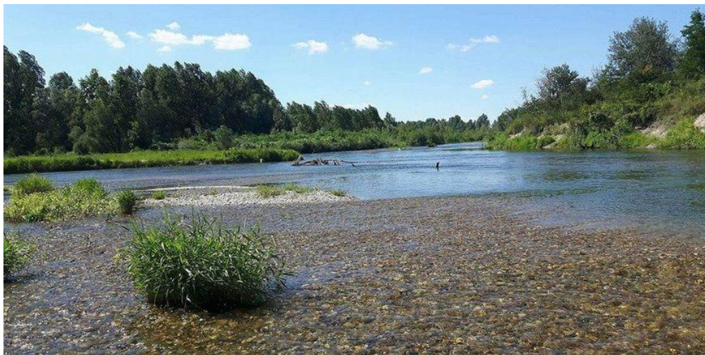
Slika 9. "Nekadašnji" tok rijeke Drave[12]

Glavne aktivnosti u sklopu projekta će se provesti na sedam lokacija duž rijeke Drave, a to su: Otok Vrije (312 – 314,3 rkm), Stara Drava Varaždin (289,3 – 292 rkm) (Slika 9), Donja Dubrava – Legrad (240 – 241,45 rkm), Most Botovo (226,6 – 227,9 rkm), Novačka (214 – 217 rkm), Miholjački Martinci (104 – 106 rkm) i Podravska Moslavina (96 – 98 rkm) [10].