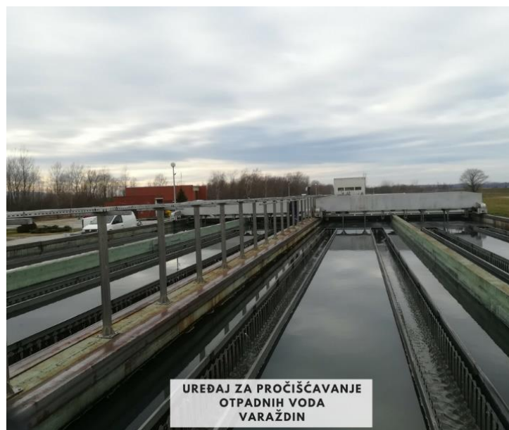
Slika 15. Uređaj za pročišćavanje otpadnih voda Varaždin [23]

Miris koji dopire iz pročistača otpadnih voda postaje sve veći problem za stanovnike Varaždina. Miris je problem koji je posljedica periodičkih izljeva najvećih onečišćivača kao što su peradarska i mljekarska industrija. U vrijeme kada je u klaonicama intenzivno klanje što je najčešće ljeti, od tamo se onda ispušta organska tvar koja u pročistač dolazi u prevelikoj koncentraciji. Osim iz industrije, neugodan miris djelomično dolazi i iz kompostane u kojoj se obrađuje mulj. Ovi problemi bi se trebali riješiti izgradnjom novog i obnovom postojećeg pročistača (slika 15). Prije realizacije tog projekta svi veliki onečišćivači bi trebali u svoj poslovni proces uključiti i predtretman otpadne vode.