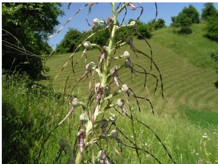
Slika 10. Jadranska kozonoška [15]

Rijeka Drava je cijelim svojim tokom uključena u Natura 2000 područje što je dokaz njezine iznimne važnosti. Isto tako na stanicama Bio portala vidljivo je koja su sve područja u Hrvatskoj obuhvaća Naturom 2000. među ostalom dostupni su i podaci o zaštićenim područjima, karta staništa, katastar speleoloških objekata i drugo. Na slici 11 prikazan je dio rijeke Drave koji je uključen u ekološku mrežu, kao što je i vidljiv dio koji prolazi kroz Varaždinsku županiju.