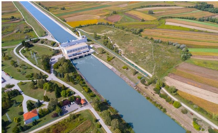
Slika 7. HE Varaždin [9]

Hidroelektrane na Dravi počele su se projektirati ranih sedamdesetih godina prošlog stoljeća na visokoj stručnoj razini (Elektroprojekt, Zagreb, u suradnji Građevinskim fakultetom u Zagrebu, institut Geoexpert i Institut građevinarstva Hrvatske, Istražni radovi Geotehnika, Zagreb, i IGH, Zagreb) [8].