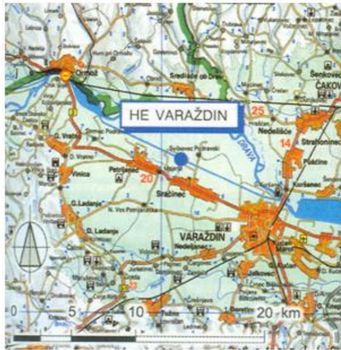
Slika 6. Položaj HE Varaždin na zemljovidu

Hidroelektrane na Dravi počele su se projektirati ranih sedamdesetih godina prošlog stoljeća na visokoj stručnoj razini (Elektroprojekt, Zagreb, u suradnji Građevinskim fakultetom u Zagrebu, institut Geoexpert i Institut građevinarstva Hrvatske, Istražni radovi Geotehnika, Zagreb, i IGH, Zagreb) [8].