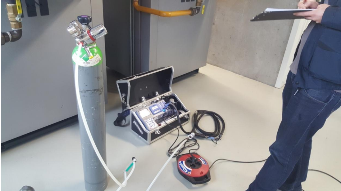
Slika 6. Umjeravanje mjernog instrumenta

Kalibraciju obavljamo na boci plina nama poznatog sastava (slika 6.), a obavlja se prije svakog mjerenja ili najkasnije svakih sat vremena.