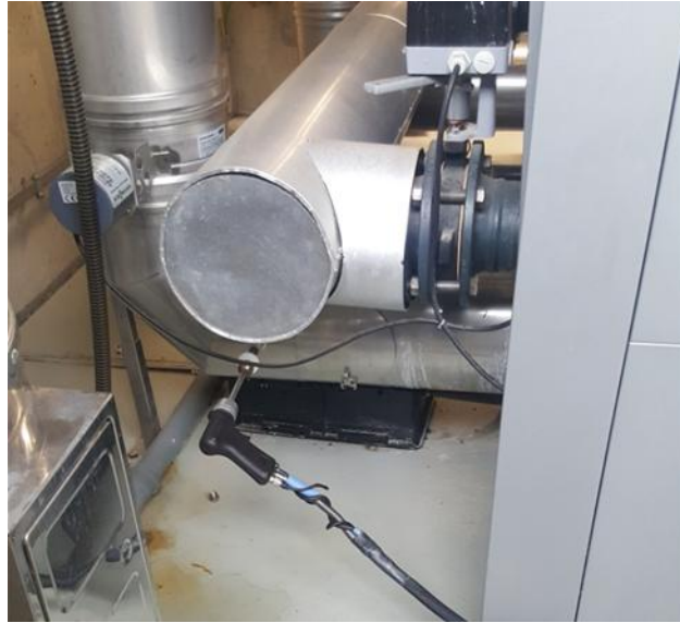
Slika 7. Sonda umetnuta u ispus

Umetanjem sonde u mjerno mjesto može započeti mjerenje emisije, mjerenje traje pola sata, a obavlja se u tri ciklusa mjerenja, sva tri u istoj mjernoj točki. Podaci se uzimaju svakih 10 sekundi, a parametre otpadnog plina koje uređaj prati su: