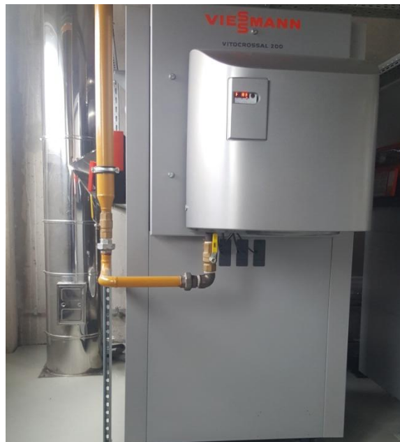
Slika 3. Plinski kondenzacijski kotao marke Vitocrossal 200

Mjerenje emisije provedeno je na plinskom kondenzacijskom kotlu marke Vitocrossal 200 (slika 3.). Uređaj za gorivo koristi zemni plin a upotrebom kondenzacijske tehnike ne koristi samo toplinu koja nastaje pri sagorjevanju goriva, već i toplinu koja kod obične tehnologije obično ostane neiskorištena. Kondenzacijski kotlovi gotovo u potpunosti izvlače toplinu koja je sadržana u dimnim plinovima te je također pretvaraju u toplinu za grijanje. Zbog toga su Viessmann kondenzacijski kotlovi opremljeni radijalnim izmjenjivačima topline od nehrđajućeg čelika koji dimne plinove prije odvođenja u dimnjak tako rashlade da se u njima sadržana vodena para ciljano kondenzira, a oslobođena se toplina dodatno prenosi u sustav grijanja [17].