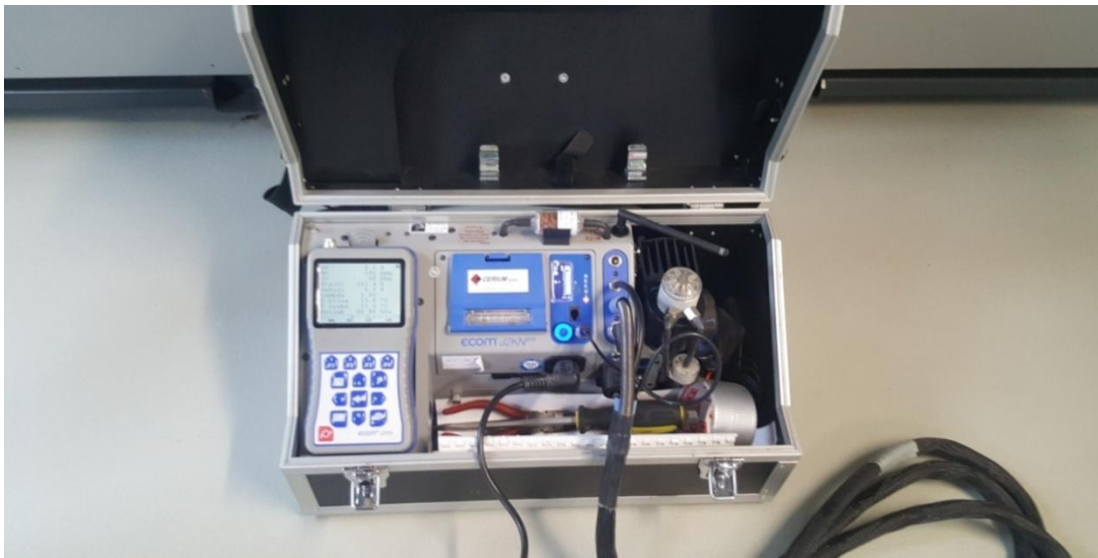
Slika 4. Analizator RBR ecom J2KNpro

uređaja za spremanje podataka a vrijednosti mjerenja mogu se otvoriti u obliku Excel tablice.