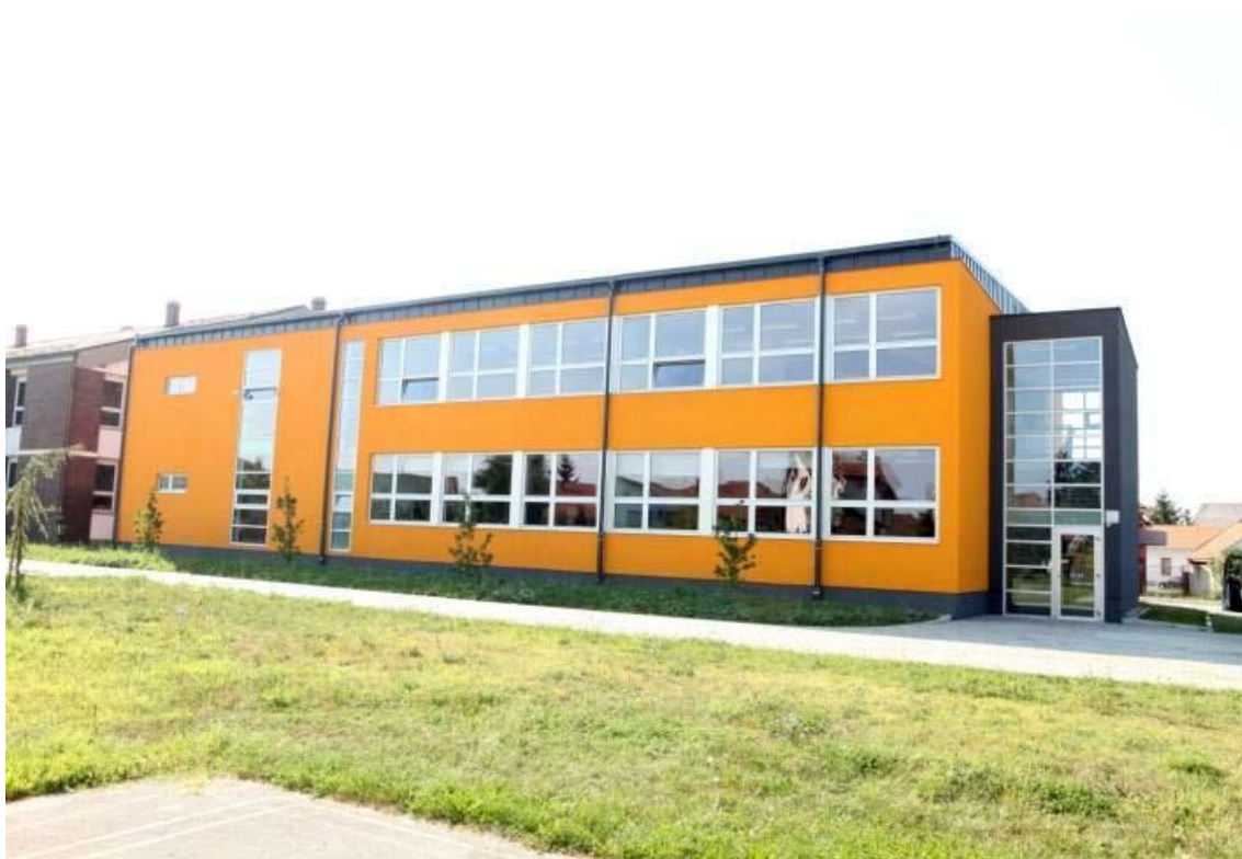
Slika 7. Sportska dvorana VI. osnovne škole u Varaždinu

U završnom radu su obrađeni samo građevinski radovi dvorane. Prema vremenskom planu izvođača izgradnja bi trebala biti gotova do 9.8.2019. Radovi nisu kasnili i danas je dvorana u potpunoj funkciji. Izgled dvorane može se vidjeti na Slici 7.