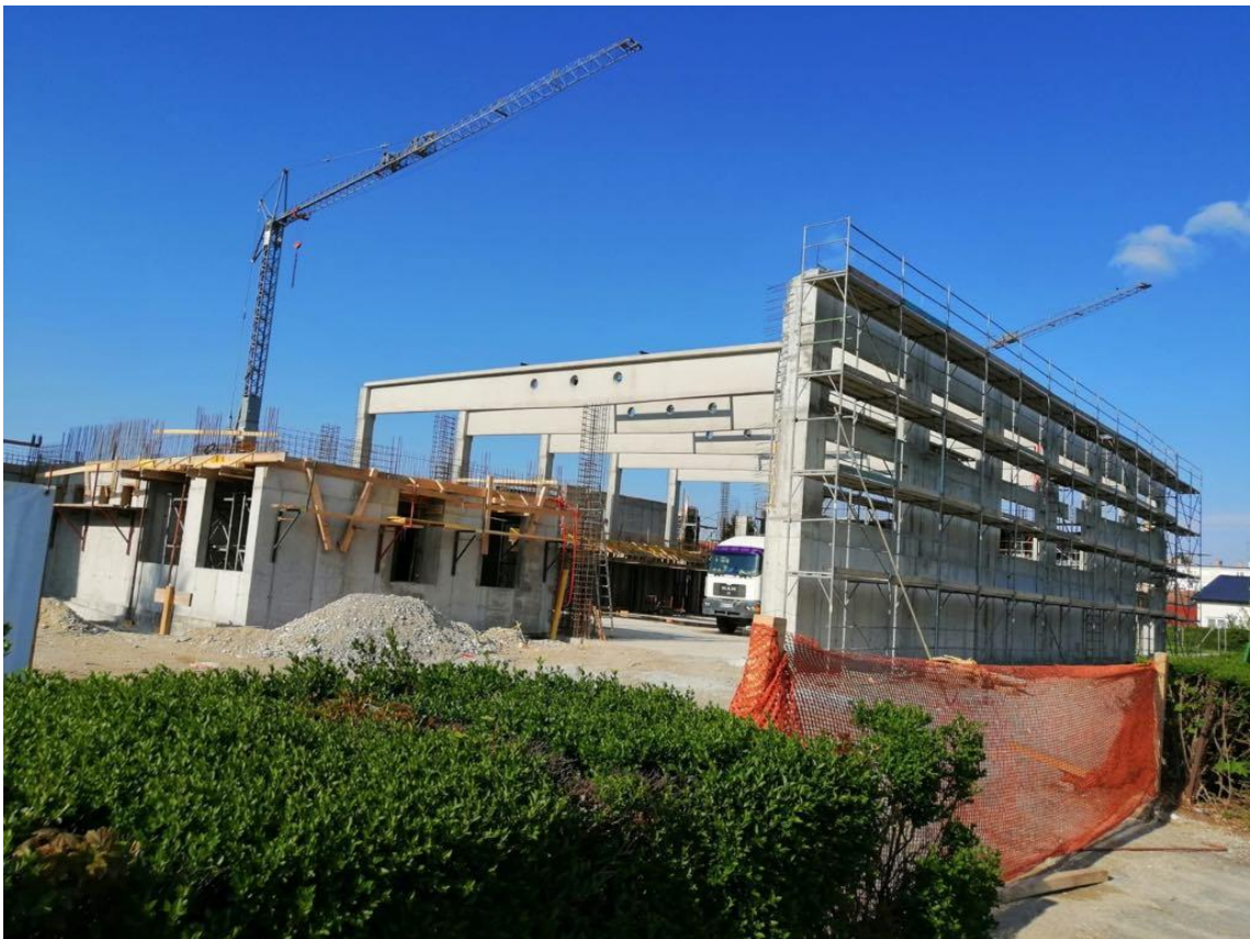
Slika 2. Prikaz konstrukcije gradnje dvorane

Hlađenje je jedino predviđeno u učionici informatike zbog odvajanja topline informatičke opreme. Tako se nazidu nalazi unutrašnje a s vanjske strane jedinica split rashladnog uređaja [3].