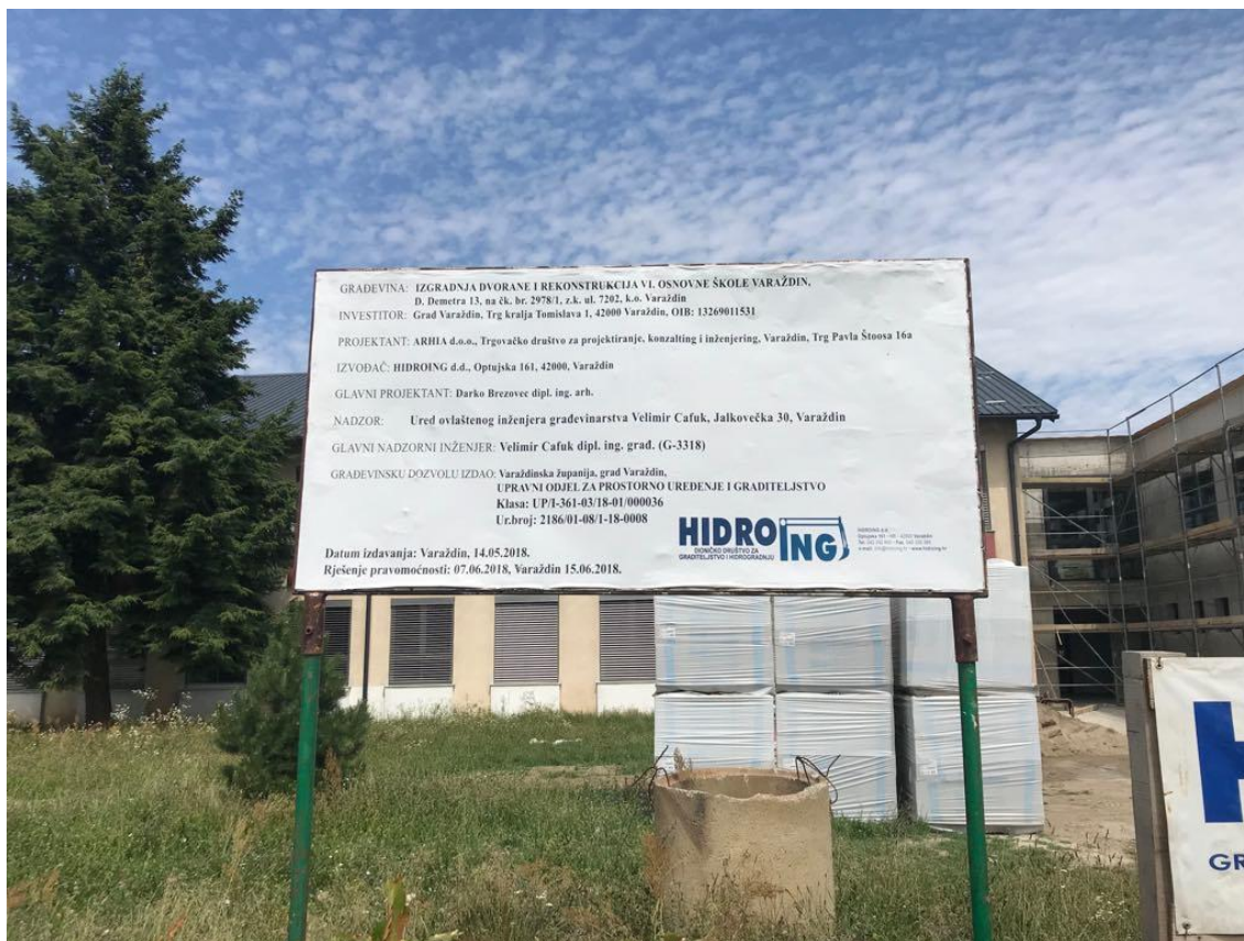
Slika 3. Tabla gradilišta za “Izgradnju sportske dvorane VI. osnovne škole u Varaždinu”

Shema gradilišta za sportsku dvoranu VI. osnovne škole u Varaždinu izrađena je osobno zbog nedostupnosti originalne sheme. Gradilište se nalazi na parceli k.č. br. 2978/1. Glavni ulaz je bio sa ulice Miroslava Krleže. Transport se obavljao sa druge strane gradilišta iz ulice Tina Ujevića. Prilikom posjeta građevini po sjećanju dok su se radovi obavljali samostalno je procijenjeno gdje bi se trebali nalziti skladišta, strojevi, prostori za upravu i radnike, razni deponiji, sanitarni čvorovi i dr. s obzirom na poziciju ograđenog gradilišta.