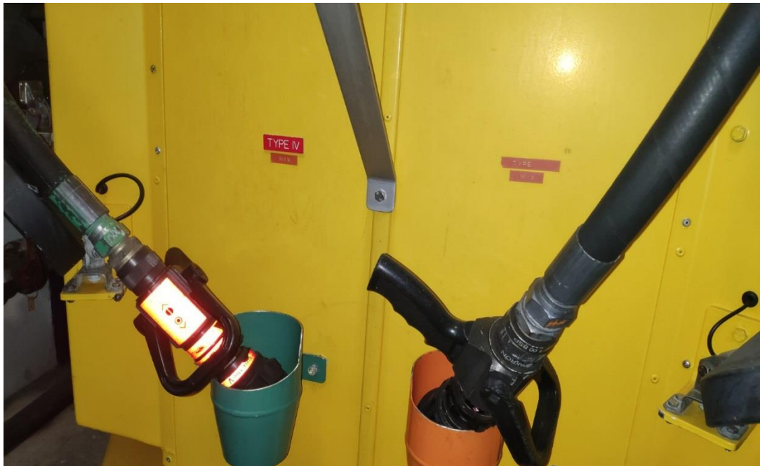
Slika 7: : Mlaznice za raspršivanje sredstva za odleđivanje

Snijeg i led se uklanjaju sa površina zrakoplova grijanim tekućinama koje se nanose iz neposredne blizine, kako bi tekućina bila raspršena po površini s što manjim termičkim gubicima, radi toga su napravljene smjernice kojih se deiceri pridržavaju kako bi se učinkovito pripremio zrakoplov u zimskim uvjetima za polijetanje.