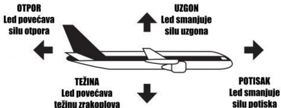
Slika 5: Utjecaj nakupljenog leda na performanse zrakoplova

Učinkovitost letnih performansi zrakoplova smanjuje se kao rezultat povećane težine, povećane brzine sloma uzgona, smanjenog uzgona, smanjene stabilnost i upravljivosti, smanjenog potiska i povećane vučne sile (Slika 3.). U takvim uvjetima, čak i naizgled beznačajno onečišćenje poput mraza može imati značajan štetni učinak [17].