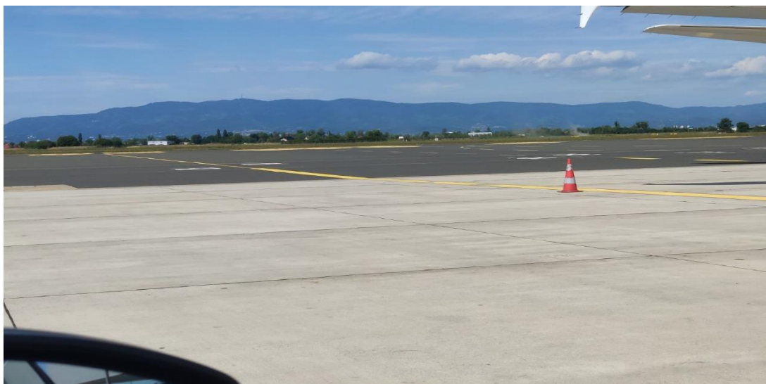
Slika 8: Prikaz nagiba stajanke u svrhu odvodnje otpadnih i oborinskih voda

Kako bi doskočili problemu odlaganja onečišćenih i otpadnih voda, prilikom dizajna aerodroma, radne površine, kao što su stajanka, poletno sletne staze, rulne staze, i dr., dizajnirane su tako da imaju blagi nagib prema putničkom terminalu, kako bi se višak onečišćenih voda mogao prikupiti i tretirati prikladno. Međutim, isto tako, nagib može biti izvršen tako da bude usmjeren od putničke zgrade, prema PSS, koje završavaju u kanalima koje potom budu usmjerene prema bazenima za tretiranje onečišćenih, i otpadnih voda.