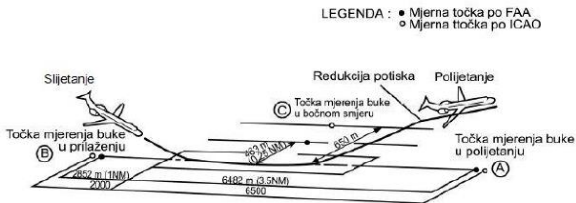
Slika 2: Referentne točke mjerenja razine buke zrakoplova pri slijetanju i polijetanju Izvor: [8]