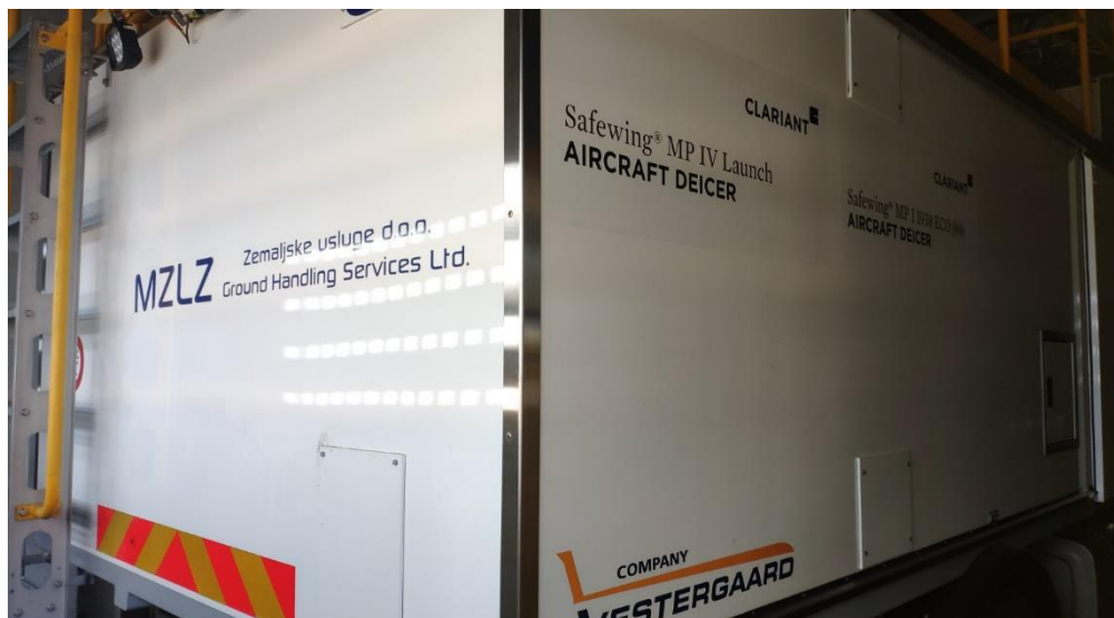
Slika 4: Vozilo za odleđivanje zrakoplova, Safewing Aircraft Deicer

Opsluživanje zrakoplova u zimskim uvjetima predstavlja značajan segment u procesu prihvata i otpreme zrakoplova. U zimskim uvjetima proces prihvata i otpreme zrakoplova se produžuje za određeni vremenski period potreban za odleđivanje i zaštitu zrakoplova protiv zaleđivanja.