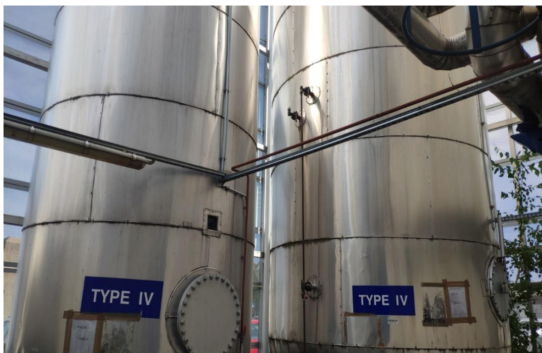
Slika 6: Spremnici za čuvanje tekućine za odleđivanje, tipa IV

Osnovna funkcija tekućine za odleđivanje i zaštitu zrakoplova protiv zaleđivanja je uklanjanje kontaminanta te snižavanje točke smrzavanja kako bi se odgodilo nakupljanje kontaminanta na kritičnim površinama zrakoplova.