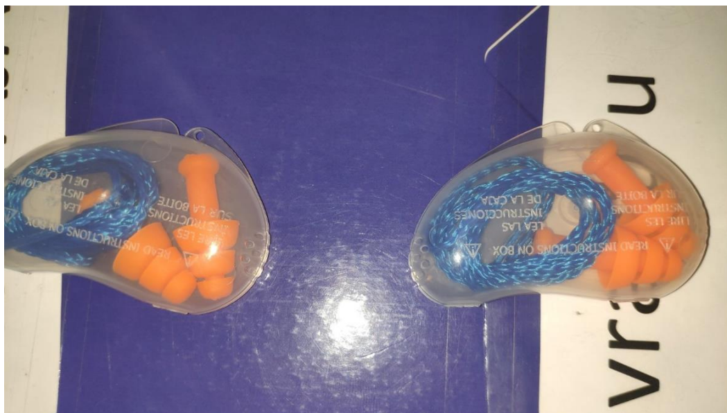
Slika 1: Sredstvo za zaštitu sluha radnika na stajanci Međunarodne Zračne Luke Zagreb

Na aerodromima u Hrvatskoj se provodi Pravilnik o uspostavljanju pravila i postupaka vezanih uz ograničenje buke na aerodromima u RH, iz 2013. godine, a on sadrži odredbe koje moraju biti usklađene s pravnim aktima EU, konkretno s Direktivom 2002/30/EZ [5]. Sva mjerenja, i sve procedure koje su potpisane od strane koncesionara zračnih luka, sa regulatornim tijelima, nadzire Agencija za civilno zrakoplovstvo.