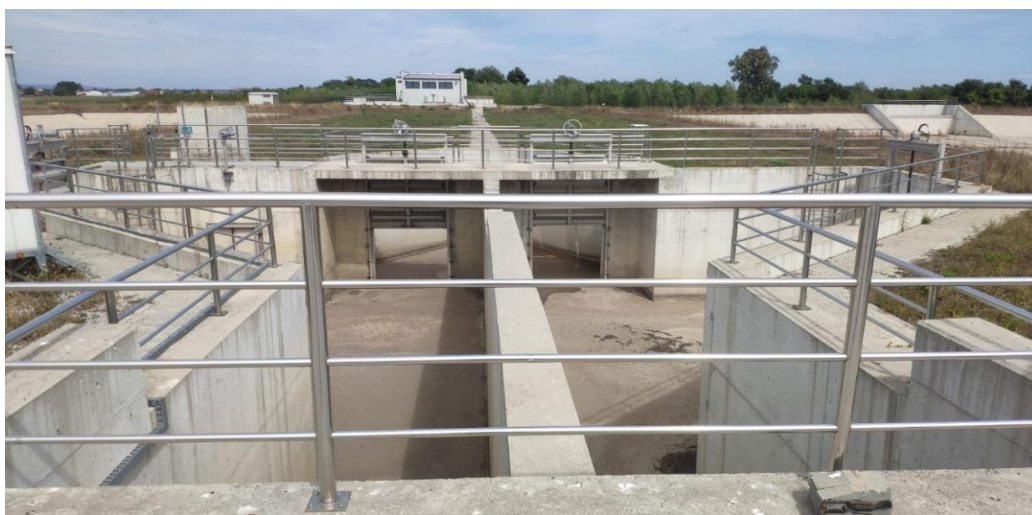
Slika 9: Bazen s odvojenim kanalima za prikupljanje otpadnih voda