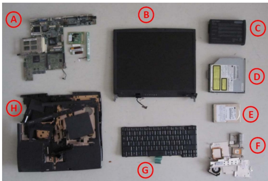
Slika 3: Glavni dijelovi prijenosnog računala

Prijenosna računala često se kvare, no ti se kvarovi mogu lako popraviti poboljšanjem dizajna ili promjenom oštećenog dijela računala. Tipični životni vijek prijenosnog računala iznosi 4 do 5 godina. Provedenim istraživanjem 2019. godine, 84% ispitanika smatra da bi Europska unija trebala djelovati na proizvođače u cilju produljenja životnog vijeka proizvoda. Čak 77% ispitanika je radije popravljalo oštećeno prijenosno računalo nego kupovalo novo(35).